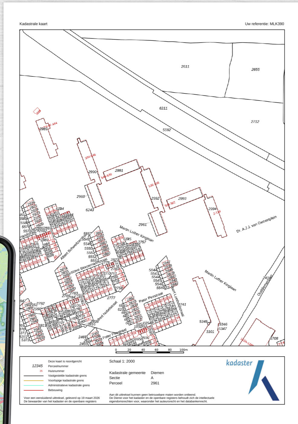
Martin Luther Kinglaan 390 Diemen