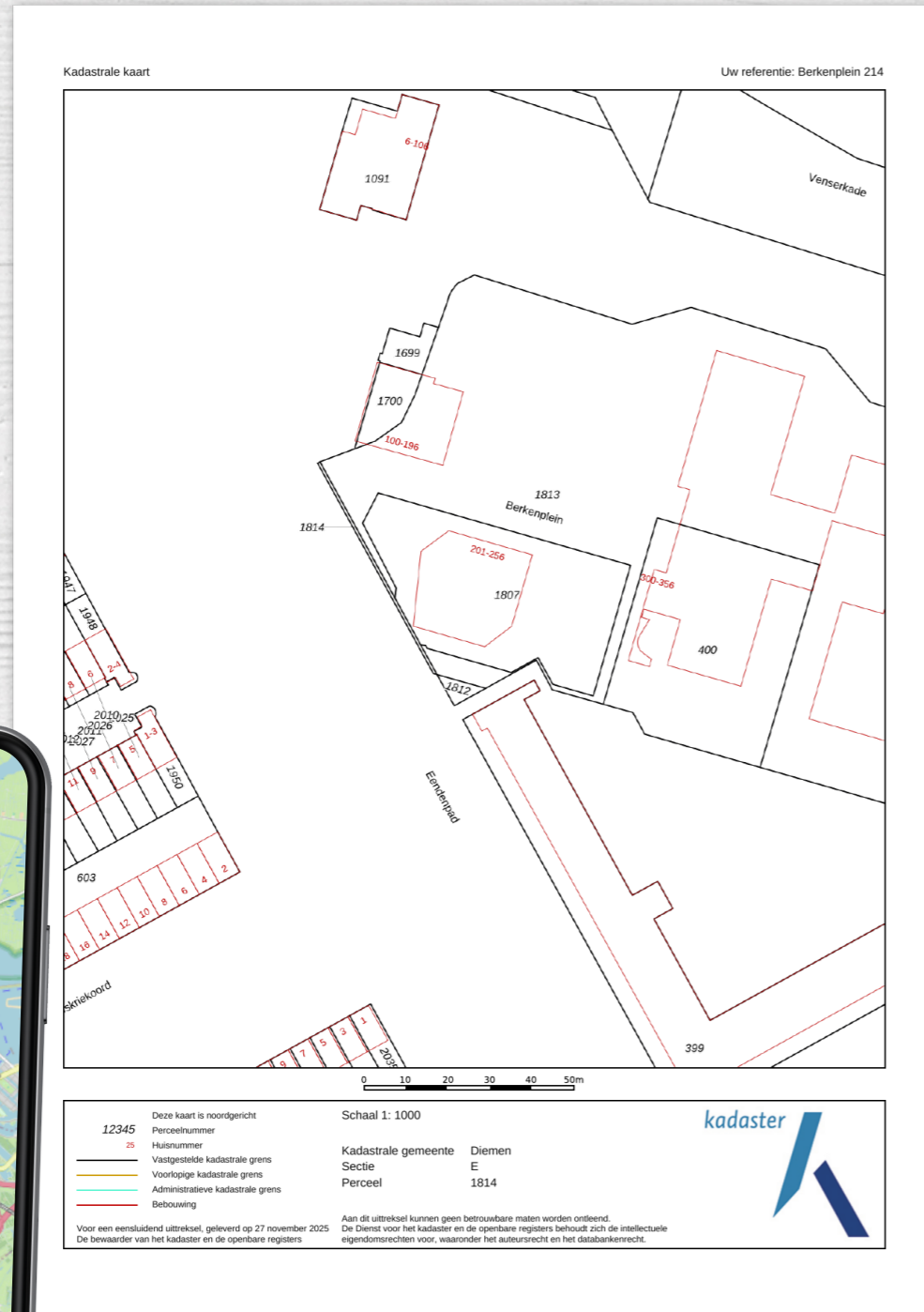
Berkenplein 215 Diemen