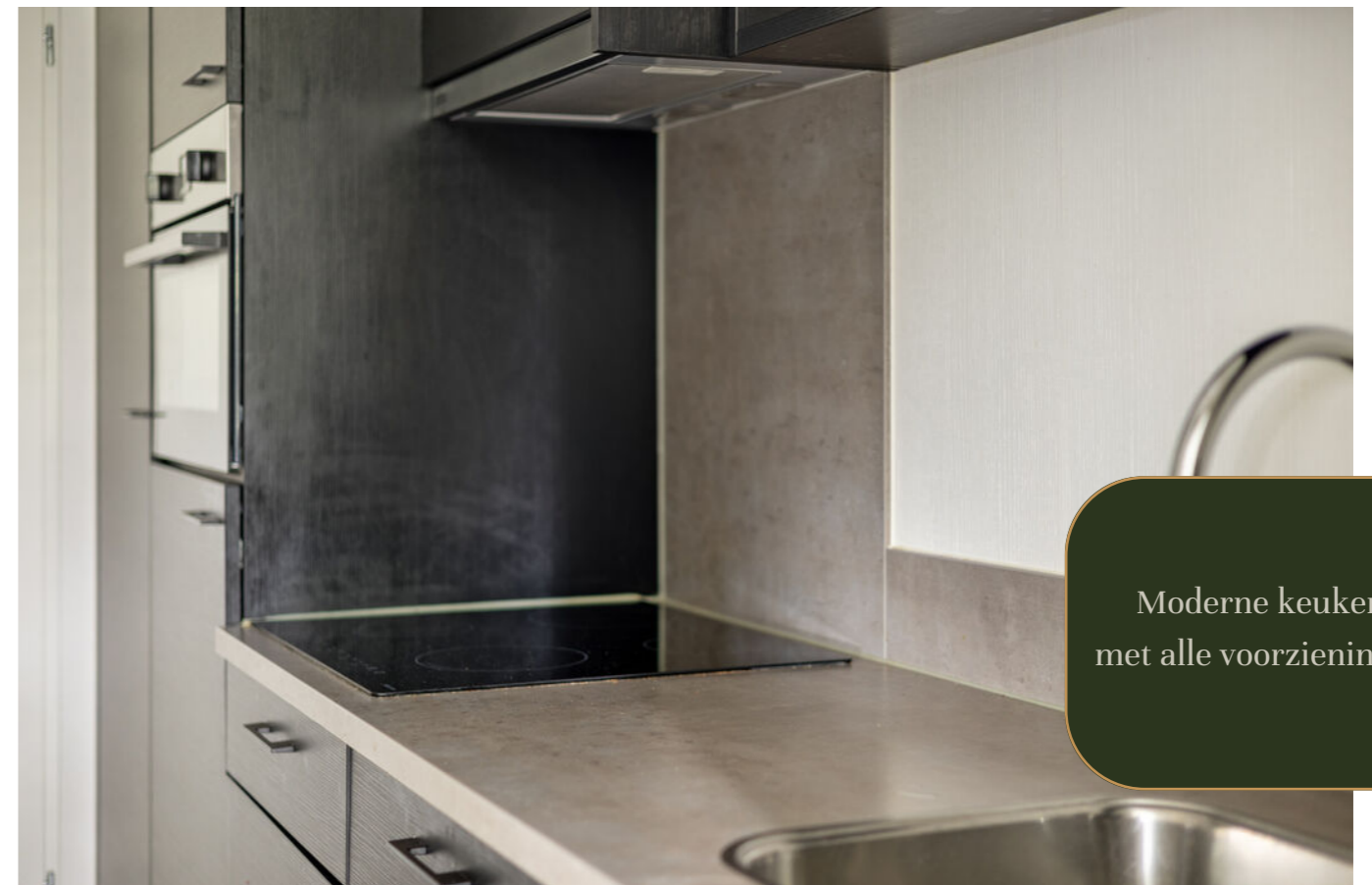
Moderne keuken met alle voorzieningen