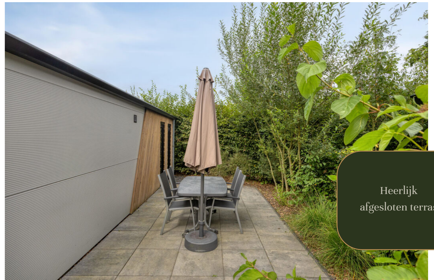
Heerlijk afgesloten terras