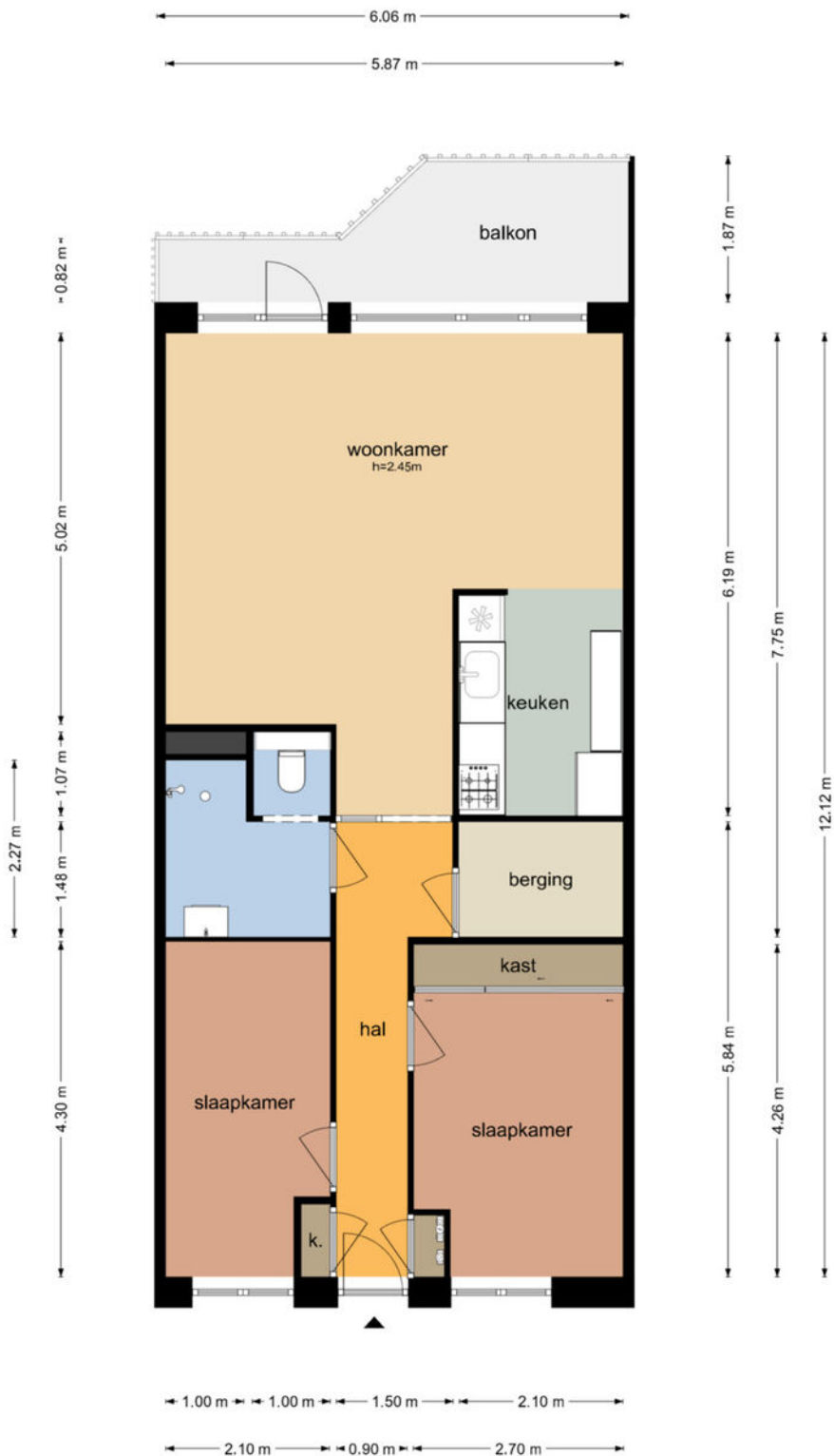
Camera Obscurastraat 39 - Amersfoort Appartement