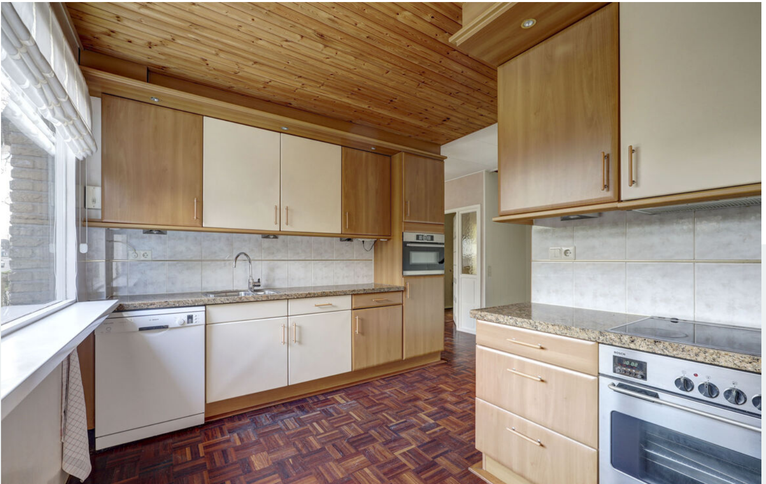
Entree/hal, toilet en keuken