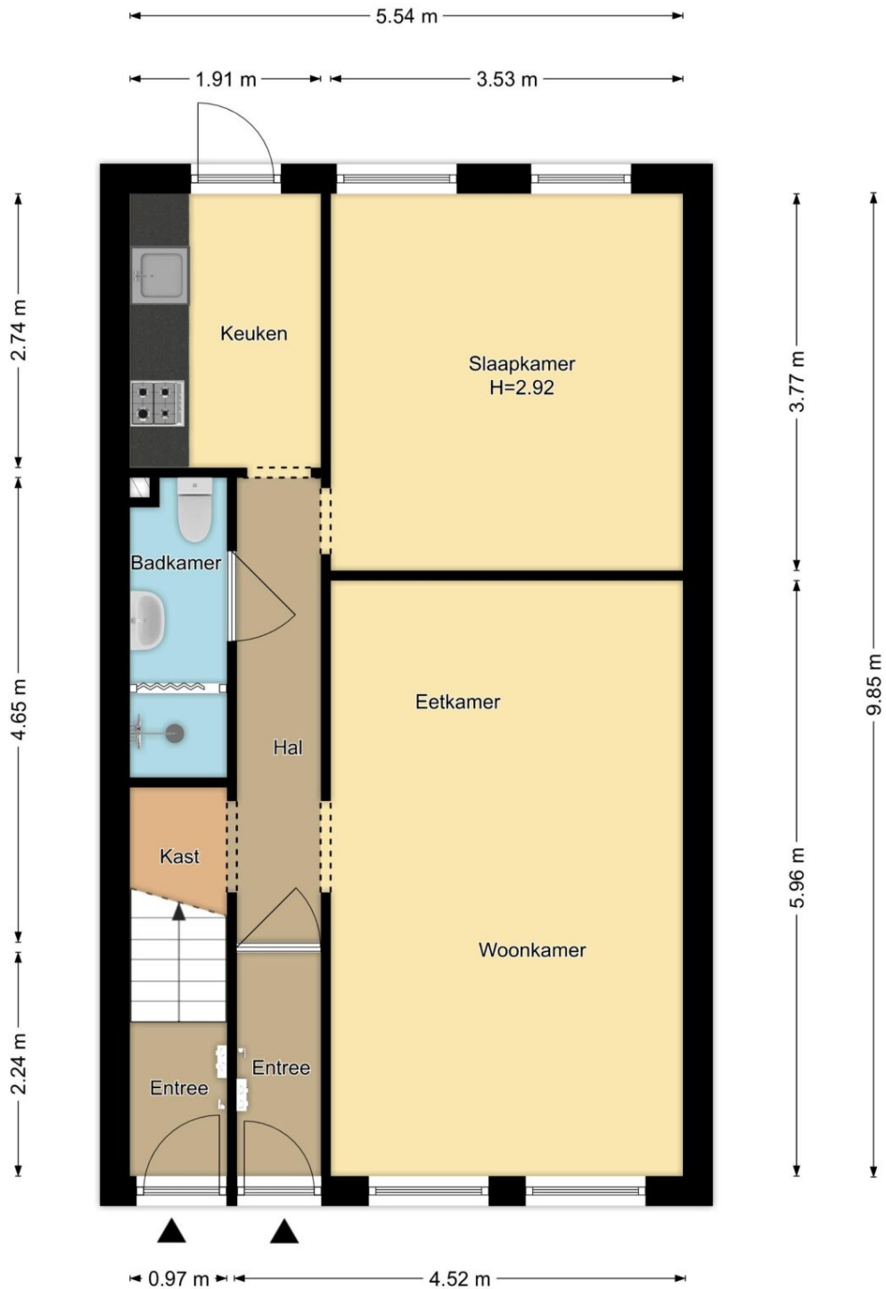
Begane Grond Gedempte Schalkburgergracht 11 Rood Zwart, Haarlem

R.M. Vastgoedpresentatie | Aan deze plattegrond kunnen geen rechten worden ontleend