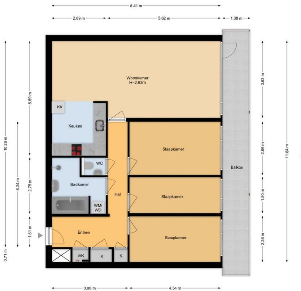
Schouthof 72 Katwijk 6e Etage

De plattegronden zijn geproduceerd voor promotionele doeleinden en ter indicatie. Aan de plattegronden kunnen geen rechten worden ontleend. www.woonkeur365.nl