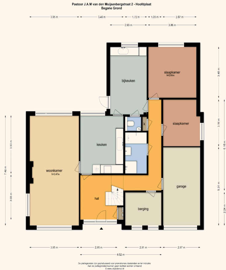
Pastoor J.A.M van den Muijsenbergstraat 2 - Hoofdplaat Berging