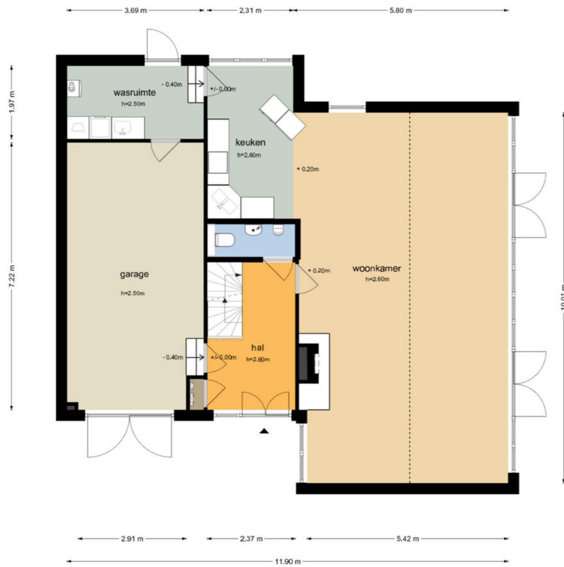
Elzenlaan 14 - Smilde Begane Grond

De plattegronden zijn geproduceerd voor promotionele doeleinden en ter indicatie. Aan de plattegronden kunnen geen rechten worden ontleend © www.objectenco.nl