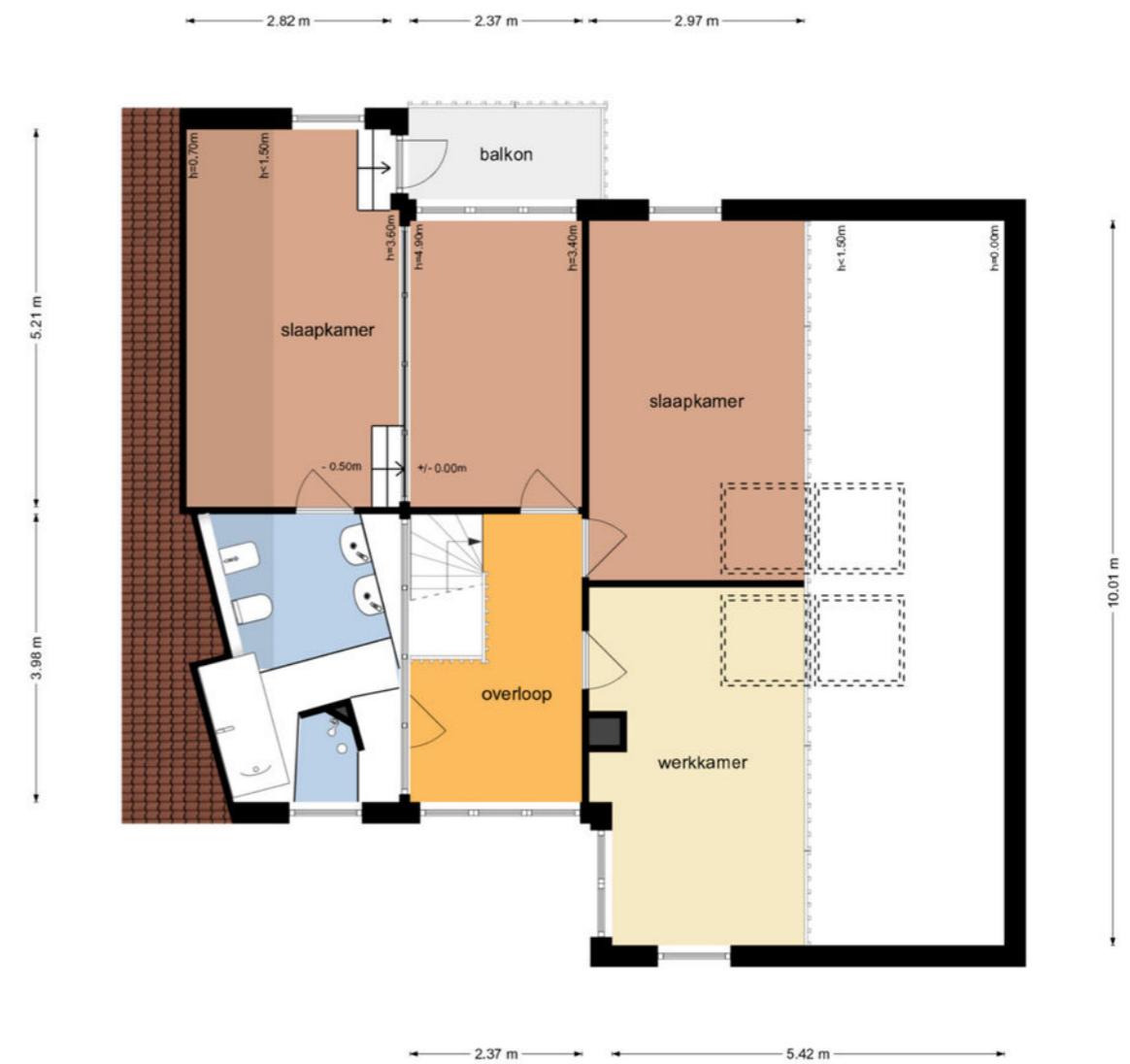
Elzenlaan 14 - Smilde Eerste Verdieping

De plattegronden zijn geproduceerd voor promotionele doeleinden en ter indicatie. Aan de plattegronden kunnen geen rechten worden ontleend © www.objectenco.nl