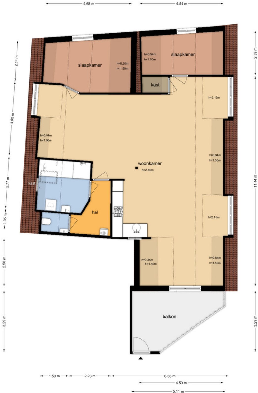
Kerkstraat 40a - Strijen Eerste Verdieping

De plattegronden zijn geproduceerd voor promotionele doeleinden en ter indicatie. Aan de plattegronden kunnen geen rechten worden ontleend.