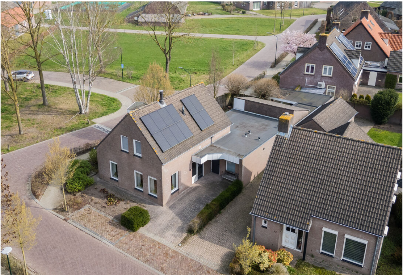
Het Vonderke 14, Hoogeloon