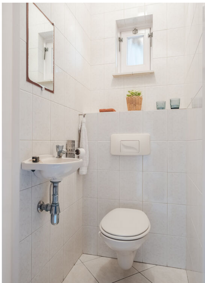
Het Vonderke 14, Hoogeloon