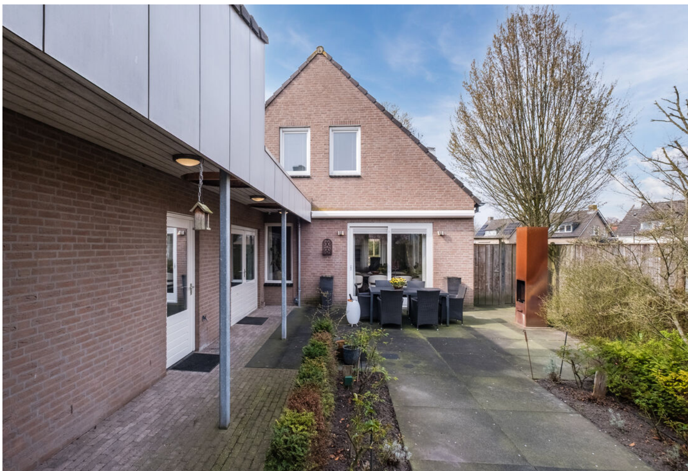
Het Vonderke 14, Hoogeloon