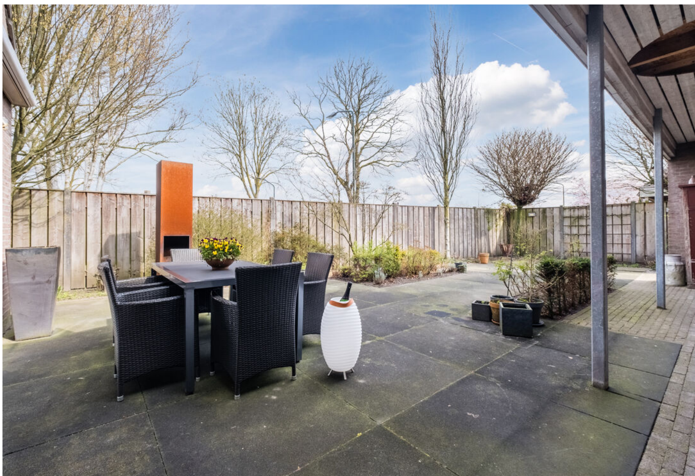
Het Vonderke 14, Hoogeloon