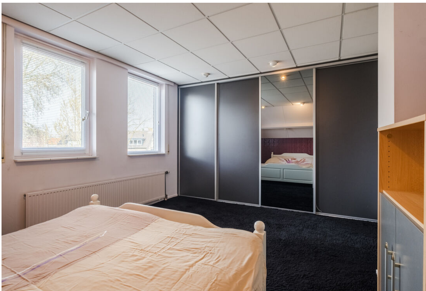
Het Vonderke 14, Hoogeloon