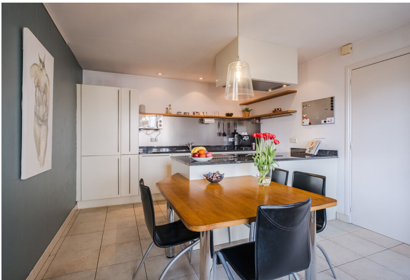
Het Vonderke 14, Hoogeloon