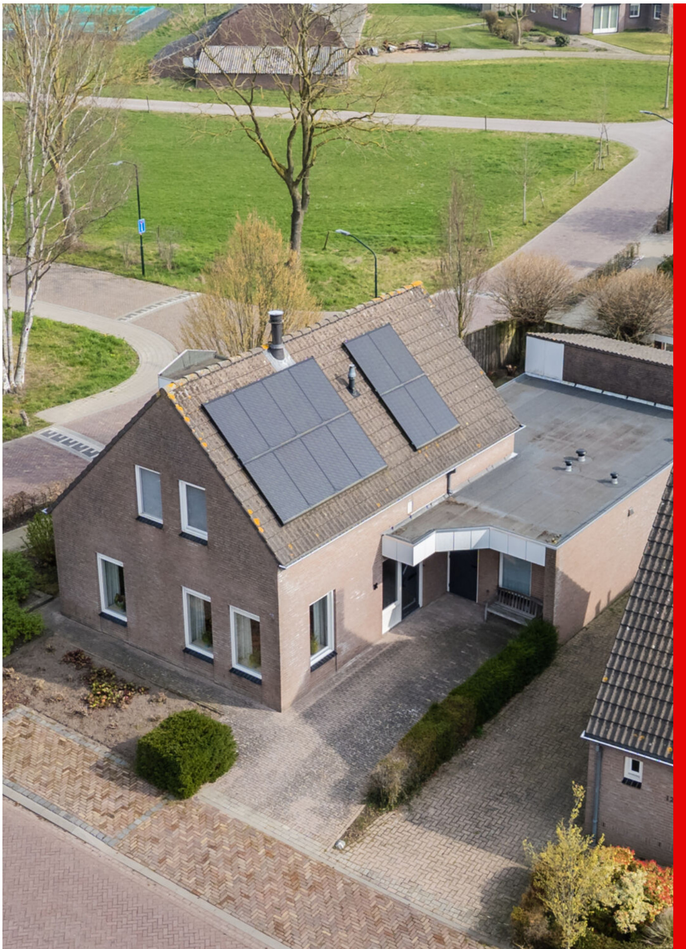
Het Vonderke 14, Hoogeloon