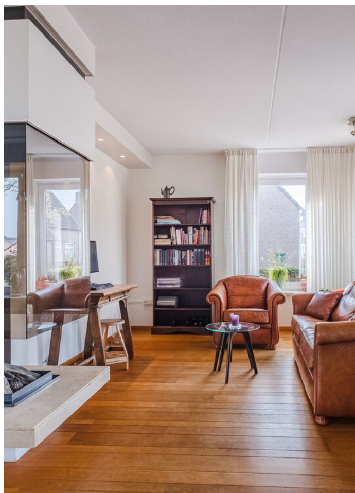
Het Vonderke 14, Hoogeloon