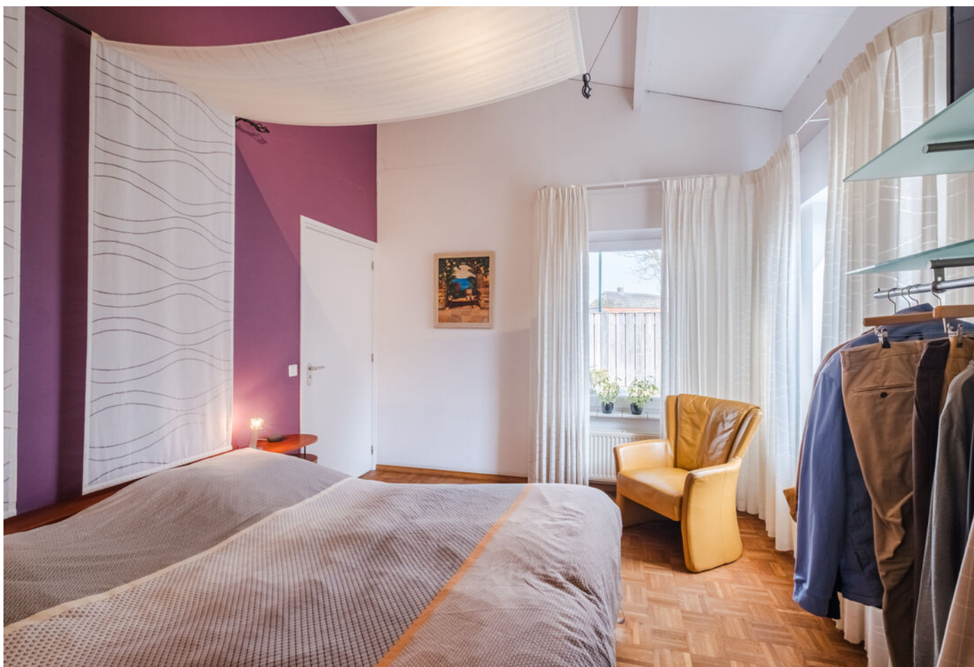
Het Vonderke 14, Hoogeloon