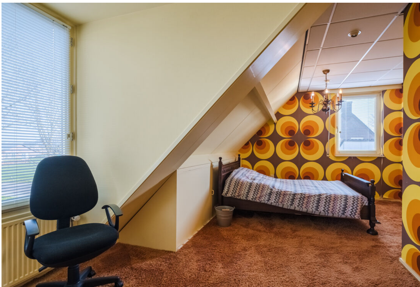
Het Vonderke 14, Hoogeloon