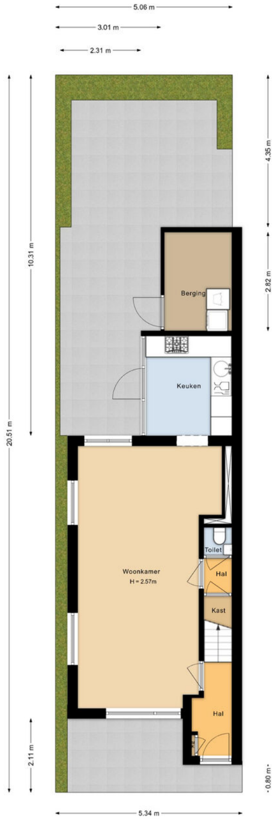
Situatie Prins Bernhardstraat 5 Voorhout