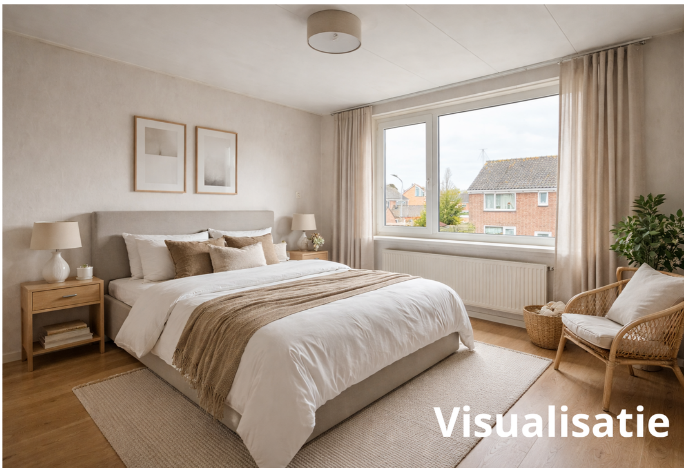
Bootsgezellenweg 2 a, Westwoud