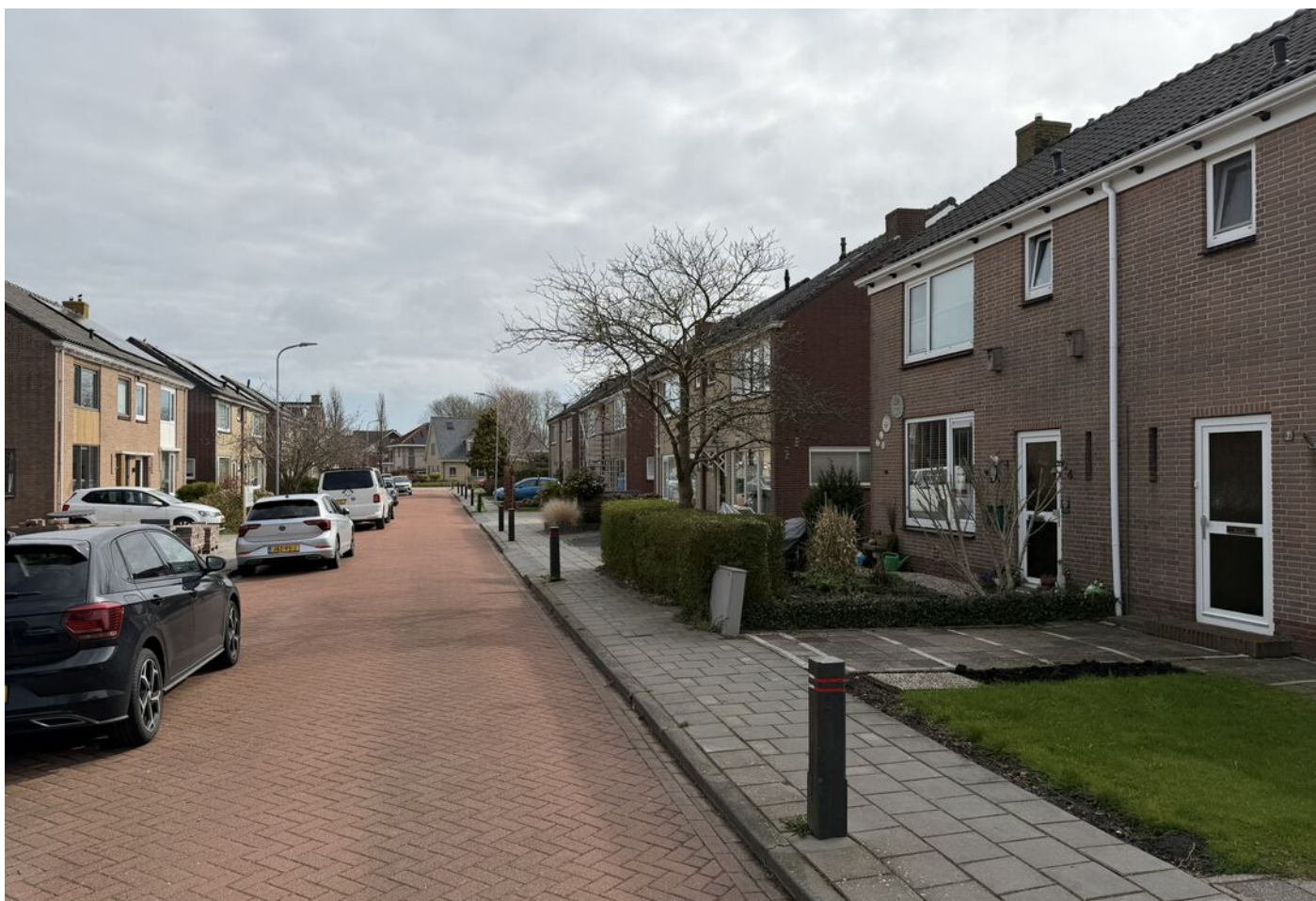
Bootsgezellenweg 2 a, Westwoud