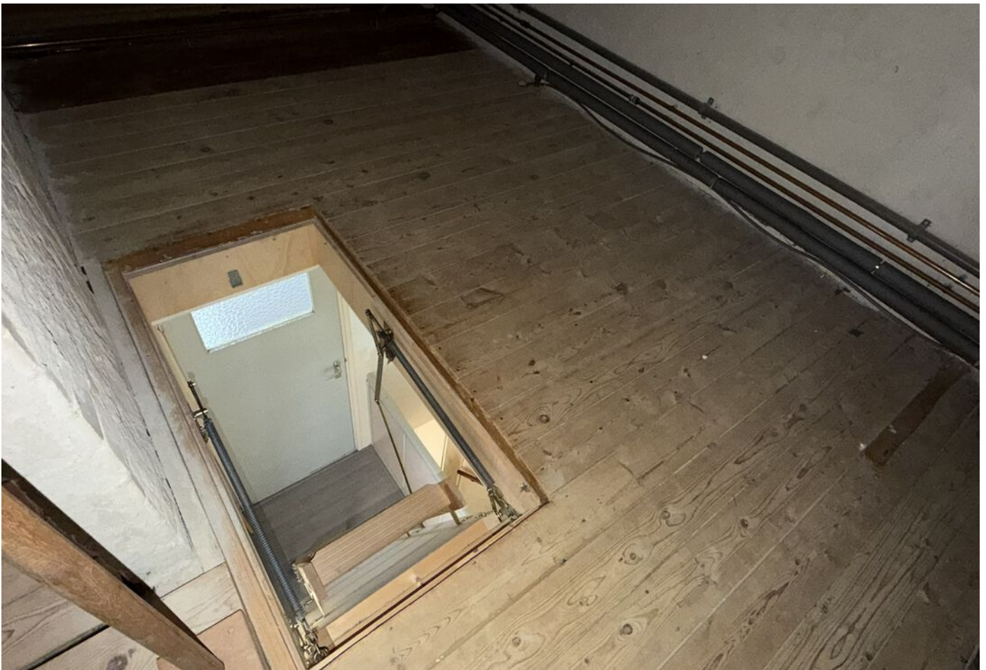
Bootsgezellenweg 2 a, Westwoud