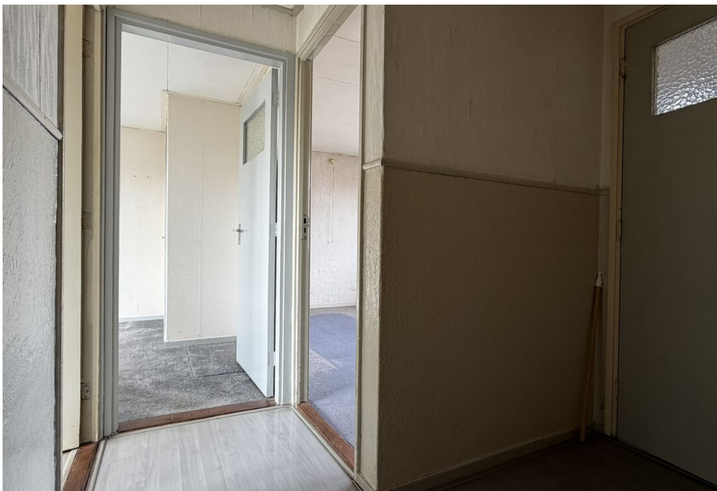
Bootsgezellenweg 2 a, Westwoud