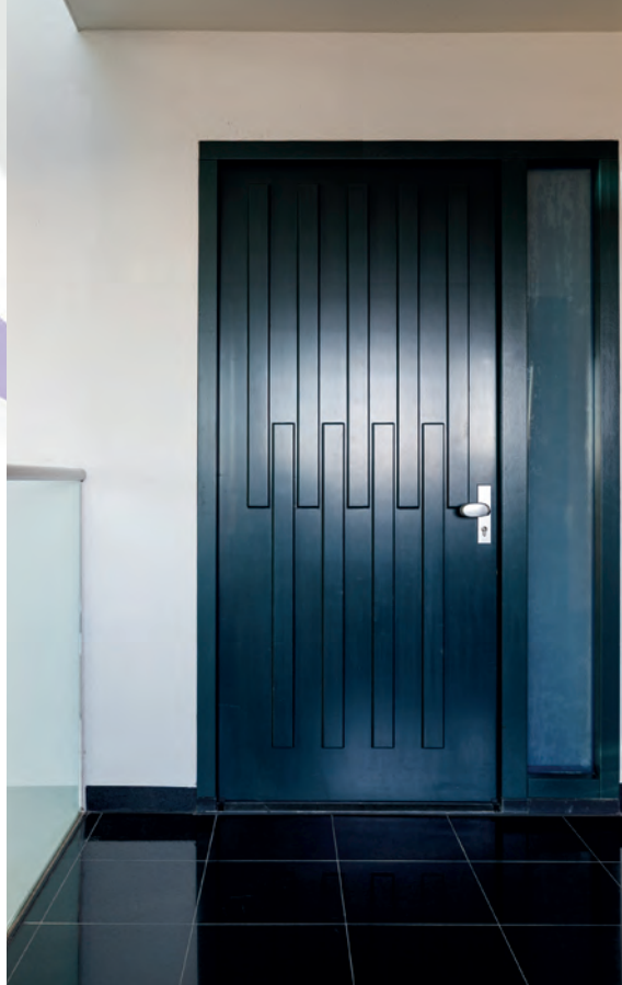
Uw woning, uw trots!