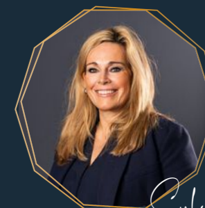
Sylvre Frontoffice medewerkster