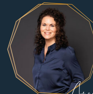
Anouk Verhuurmakelaar/ Nieuwbouw