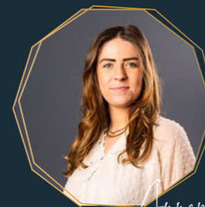
Annemijn Binnendienst hypotheek