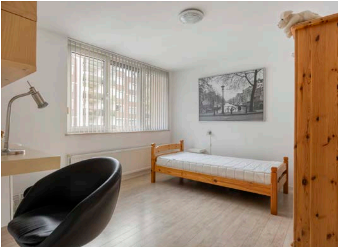
Compleet en functioneel