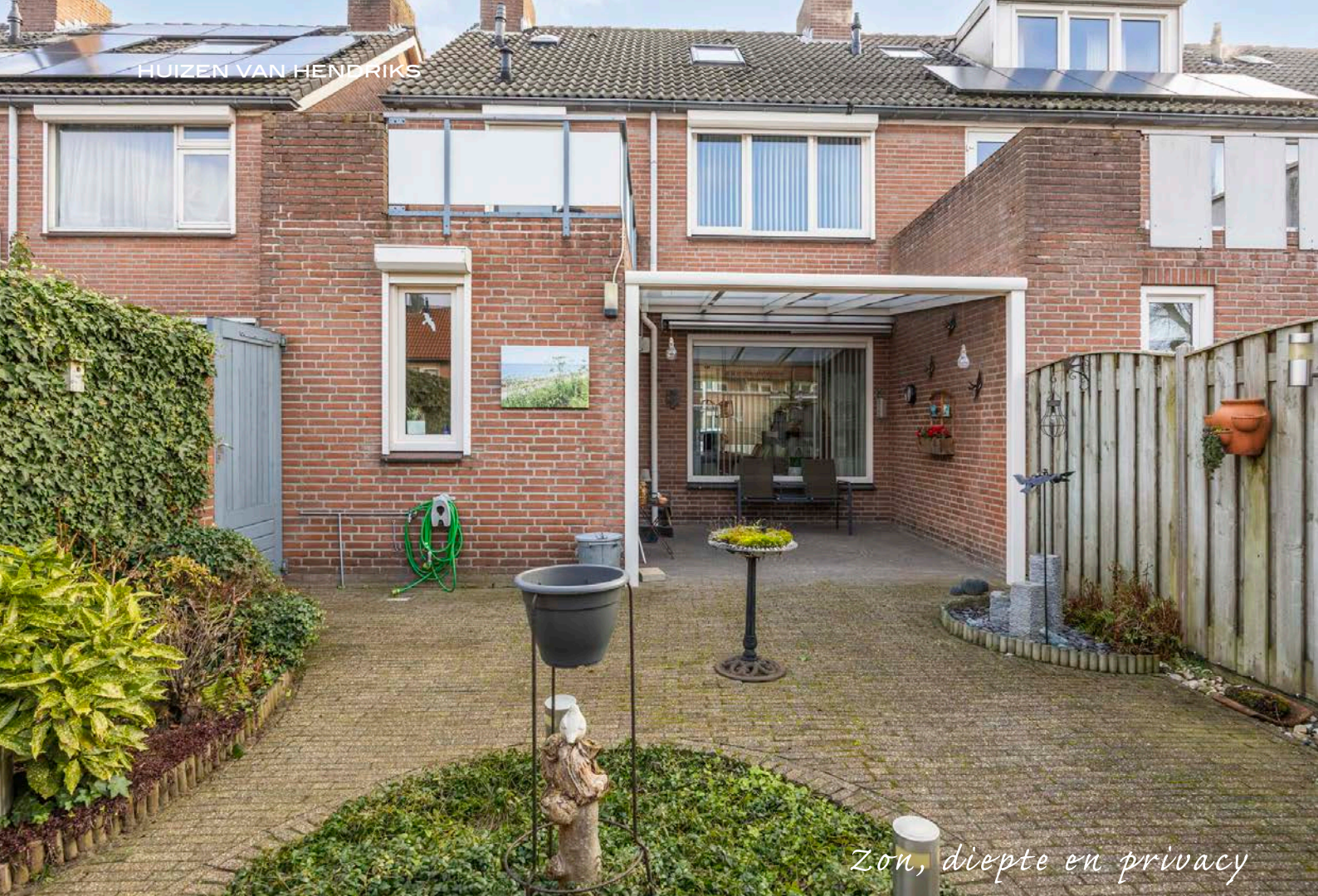
Zon, diepte en privacy