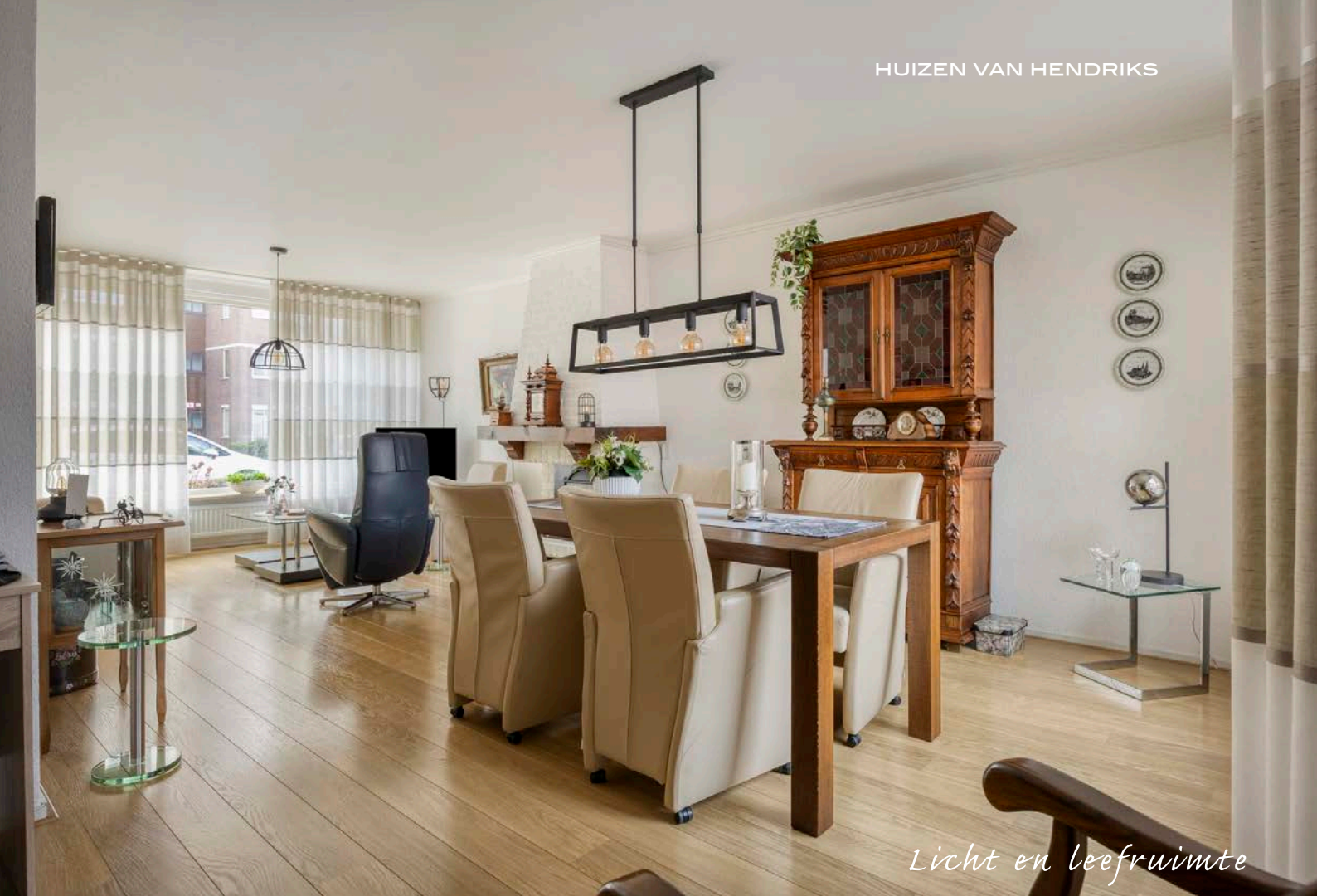
Licht en leefruimte