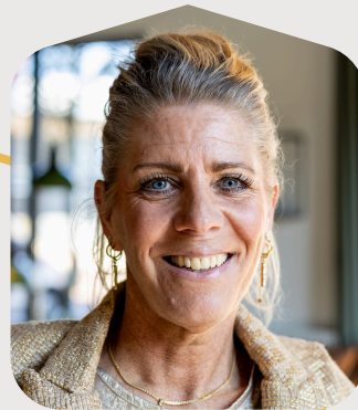
Brenda Klantsupport wonen