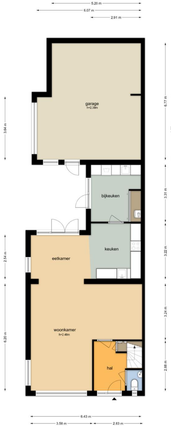
Prinses Margrietstraat 28 - Wehl Begane Grond

De plattegronden zijn geproduceerd voor promotionele doeleinden en ter indicatie. Aan de plattegronden kunnen geen rechten worden ontleend. © www.objectenco.nl