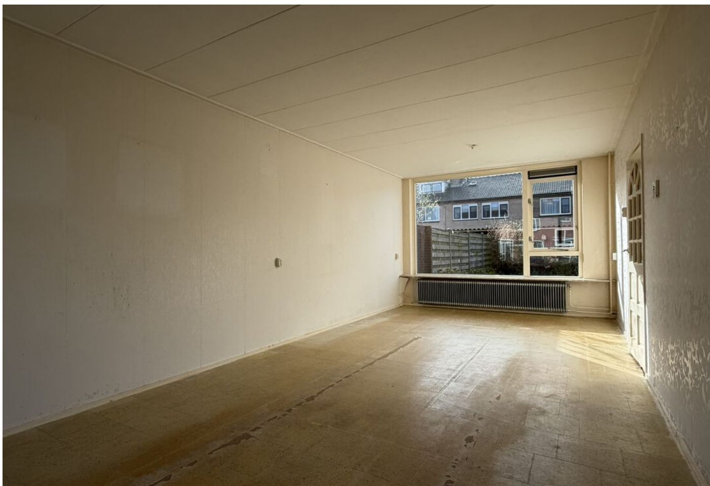
Koggestraat 8, Wervershoof