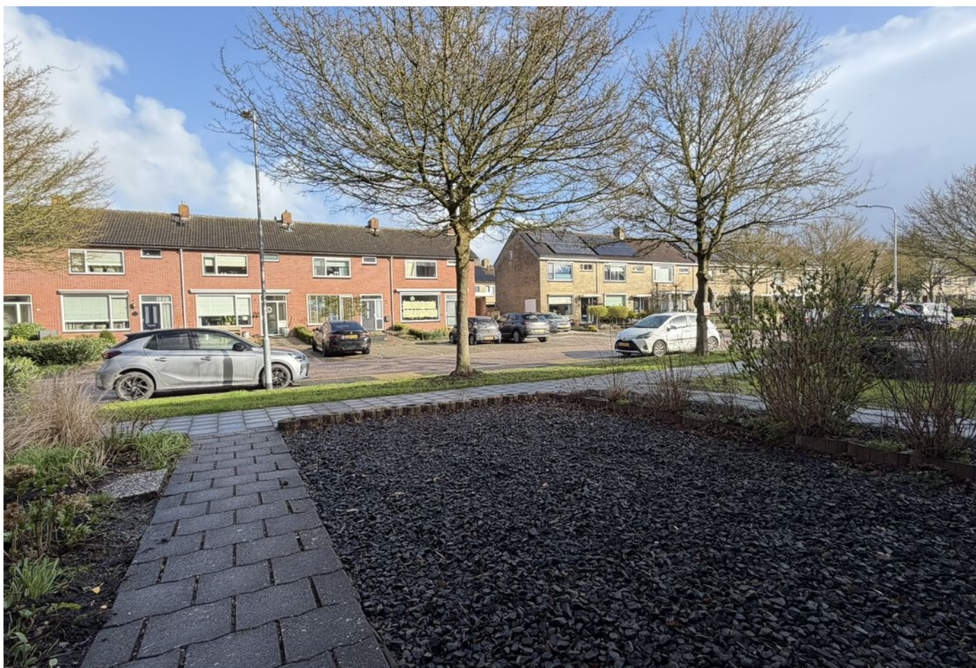
Koggestraat 8, Wervershoof