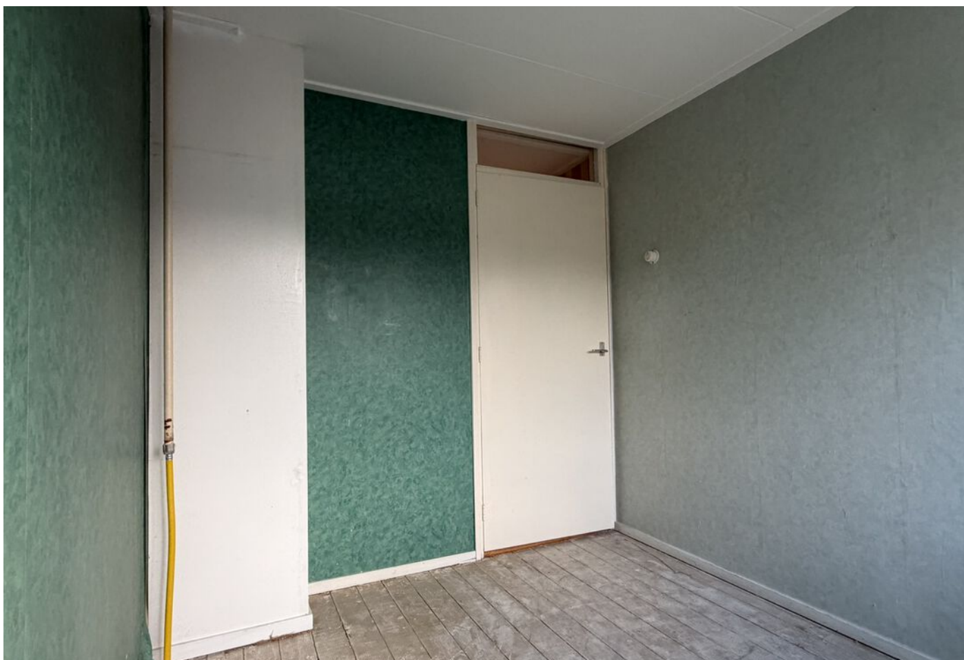
Koggestraat 8, Wervershoof