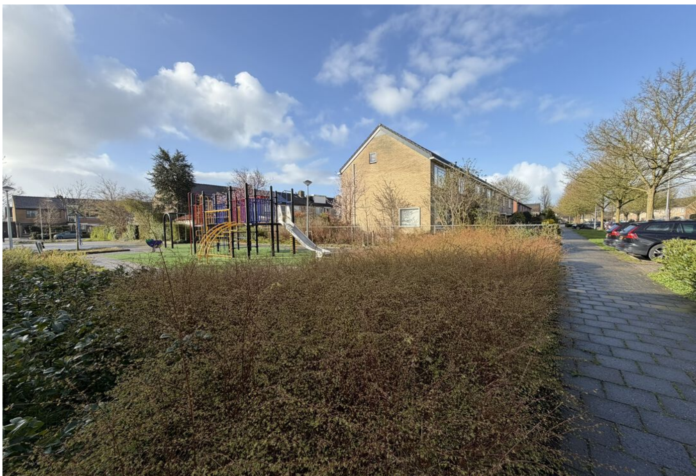
Koggestraat 8, Wervershoof