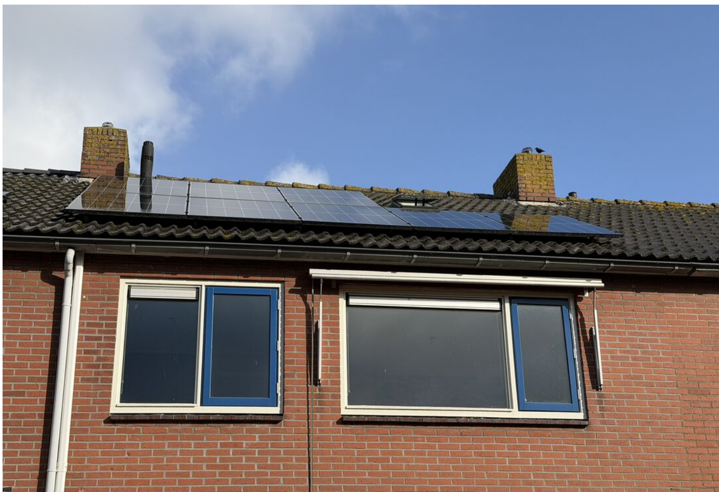
Koggestraat 8, Wervershoof