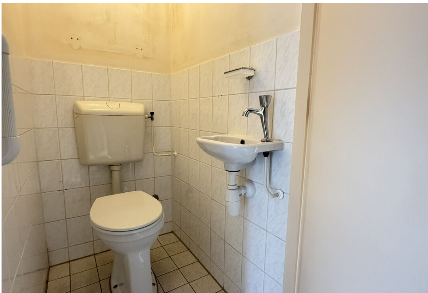
Koggestraat 8, Wervershoof