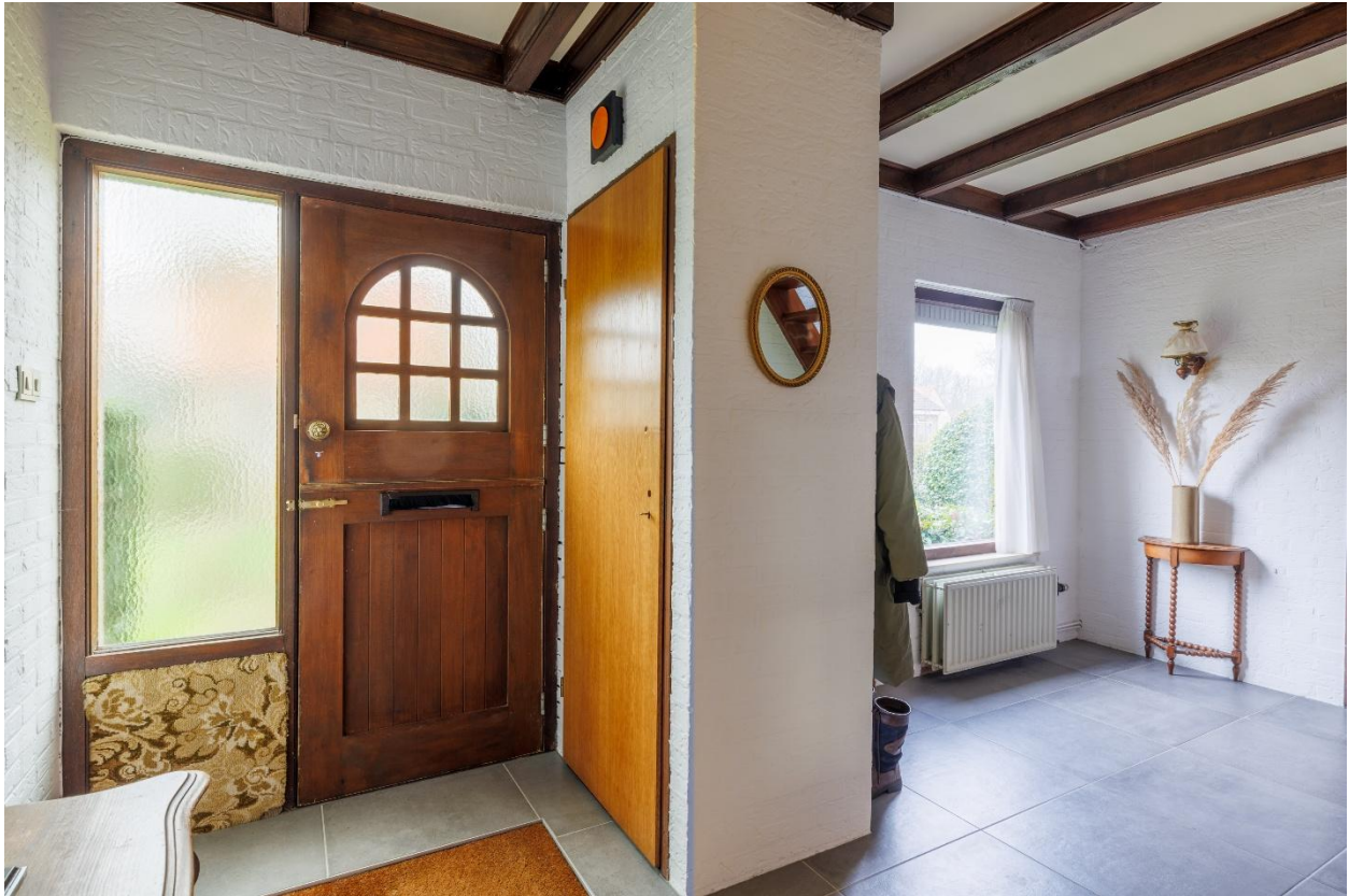
Entree met trapopgang