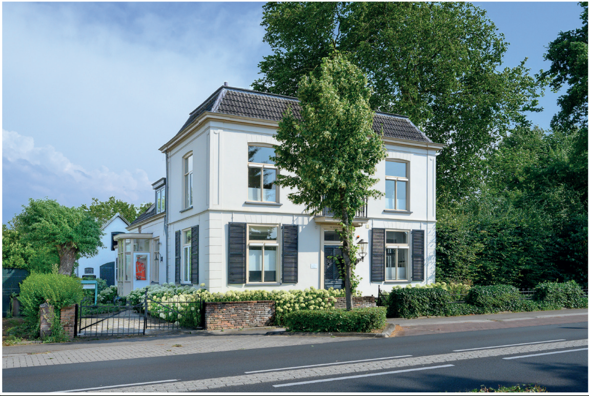
Leuvenheim Arnhemsestraat 81