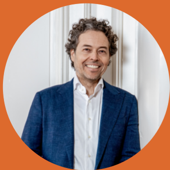
CHRISTIAN Register makelaar

We helpen je graag verder op weg naar jouw droomhuis.