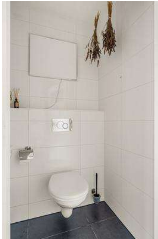
Nack 12 Wijkstermer Eerste verdieping