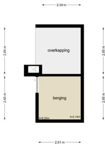
Zomerdijk 90 - Noordeinde GID Berging

De plattegronden zijn geproduceerd voor promotionele doeleinden en ter indicatie. Aan de plattegronden kunnen geen rechten worden ontleend