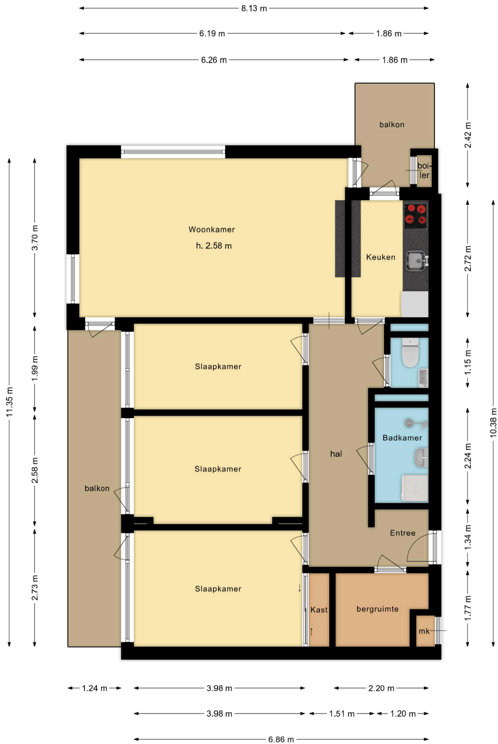
Schotlandstraat 47 Haarlem 6e verdieping