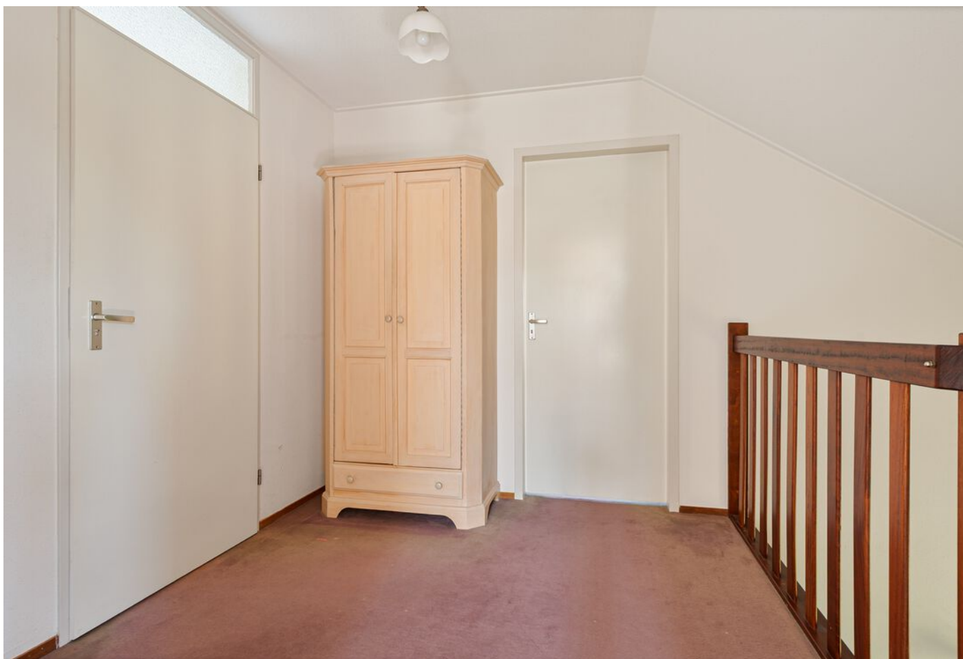
Dom Paul Bellotweg 2, Eindhoven