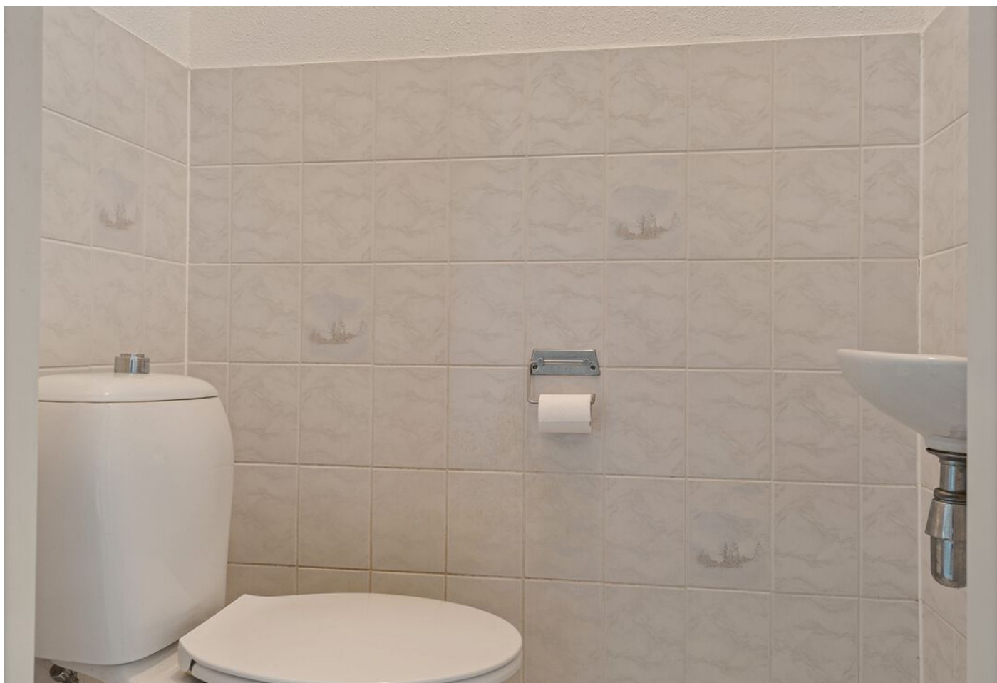
Dom Paul Bellotweg 2, Eindhoven