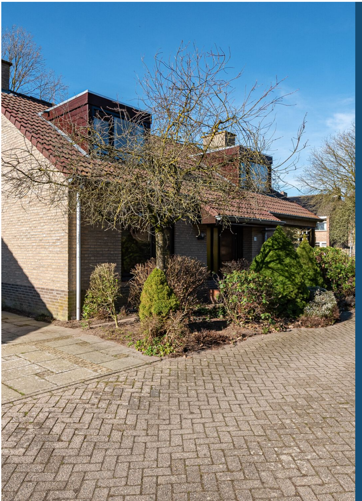
Dom Paul Bellotweg 2, Eindhoven