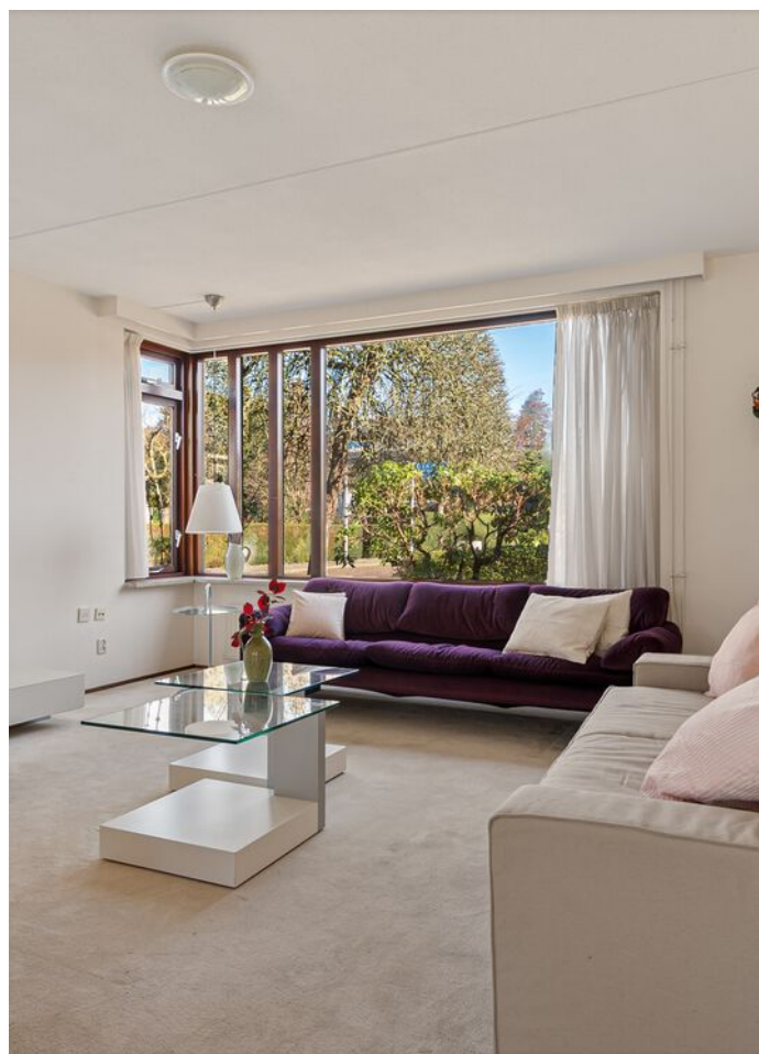
Dom Paul Bellotweg 2, Eindhoven