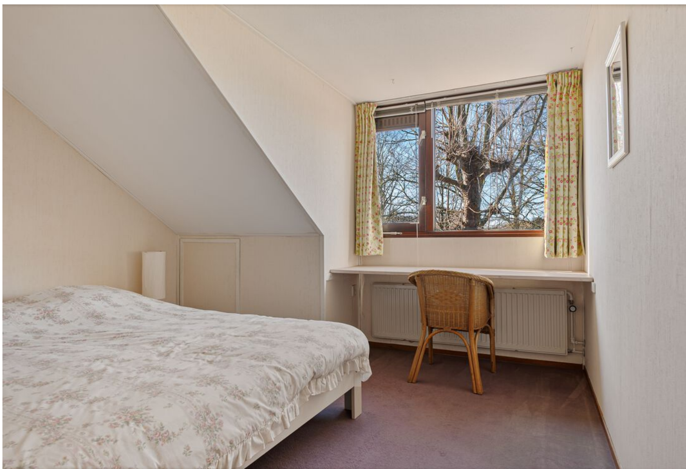
Dom Paul Bellotweg 2, Eindhoven