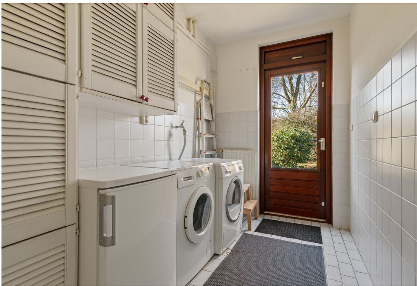
Dom Paul Bellotweg 2, Eindhoven