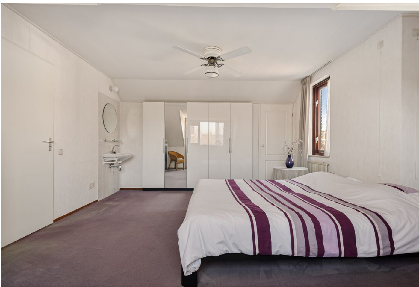
Dom Paul Bellotweg 2, Eindhoven