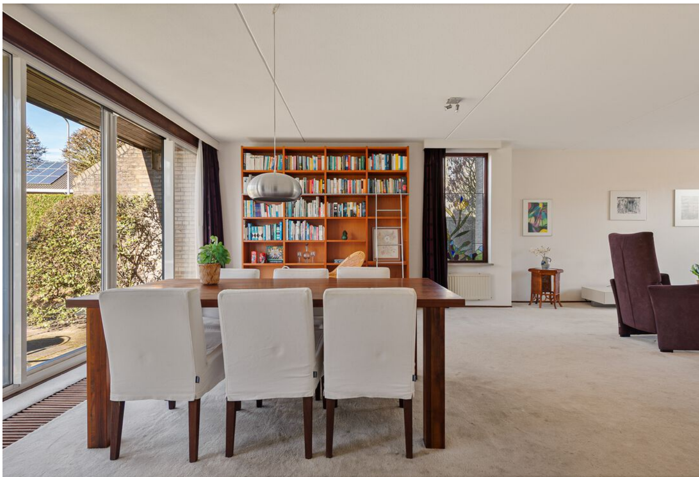
Dom Paul Bellotweg 2, Eindhoven