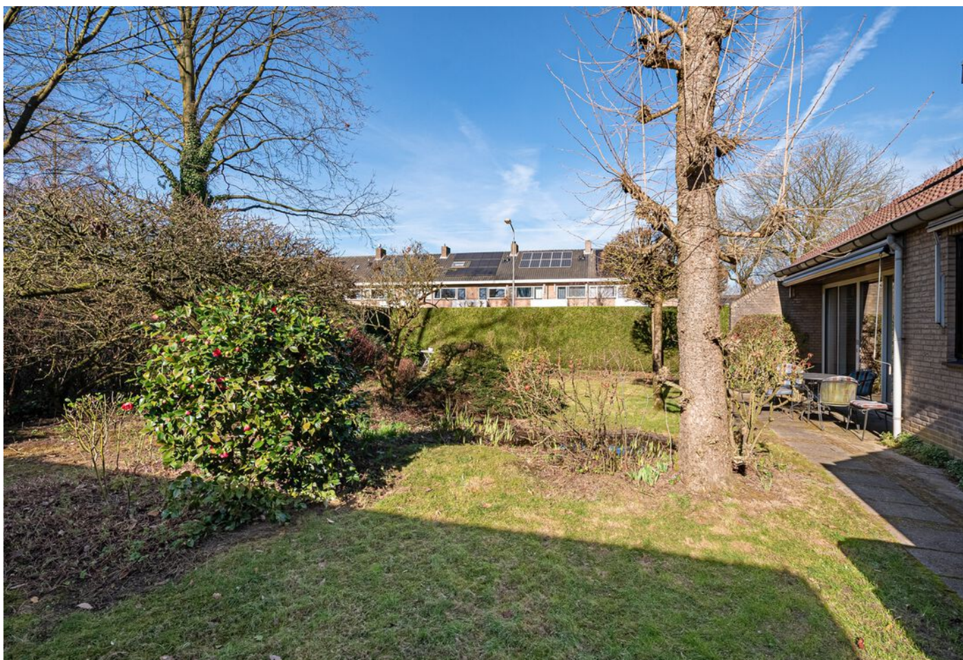
Dom Paul Bellotweg 2, Eindhoven