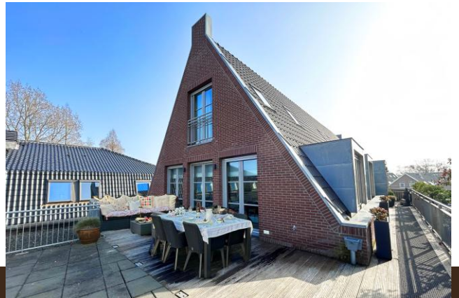
Amsterdamsestraatweg 44 Abcoude