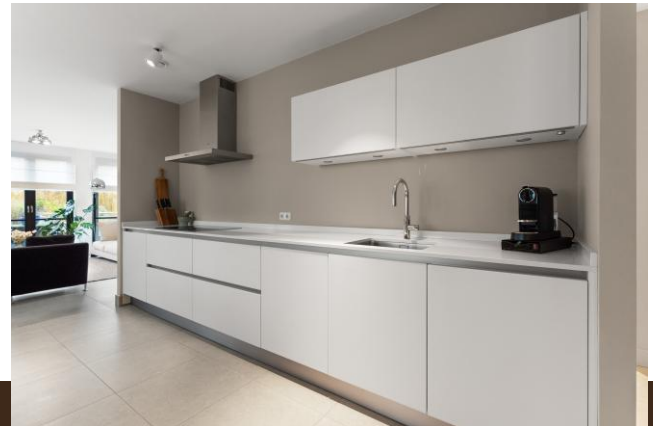
Amsterdamsestraatweg 44 Abcoude