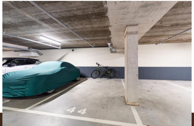
Amsterdamsestraatweg 44 Abcoude