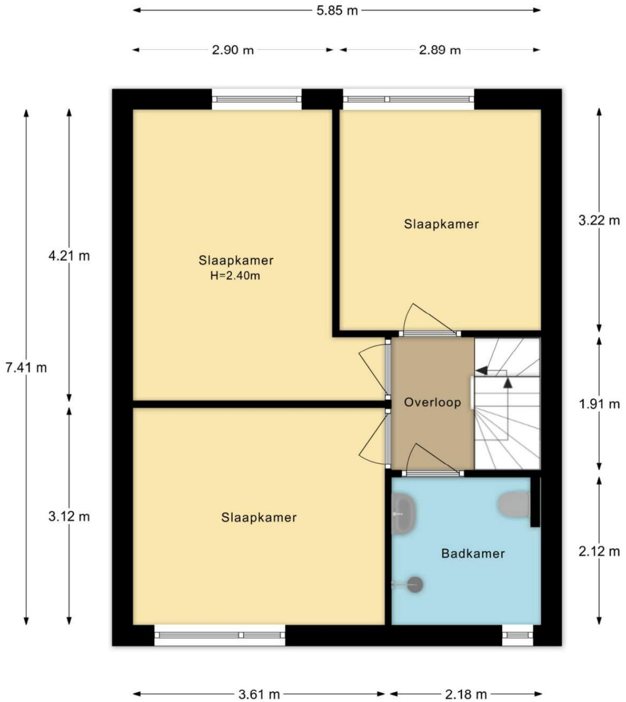
Blankenstraat 157 Hoofddorp 1e Verdieping