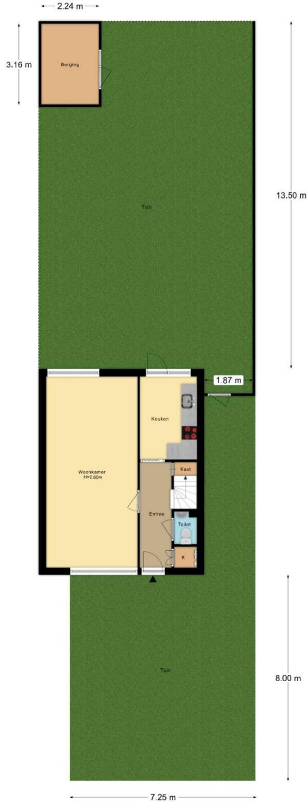
Blankenstraat 157 Hoofddorp Situatie