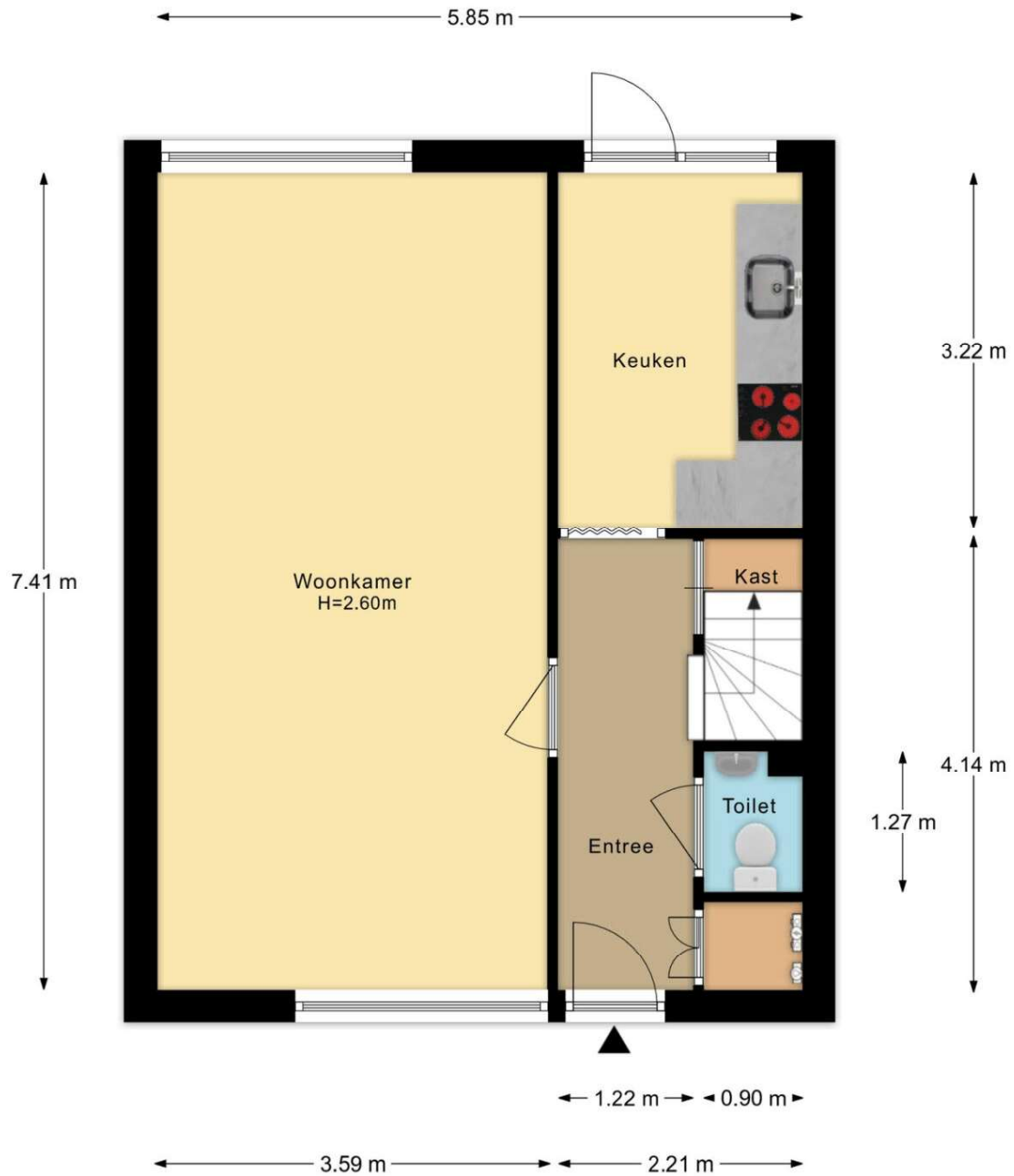
Blankenstraat 157 Hoofddorp Begane Grond