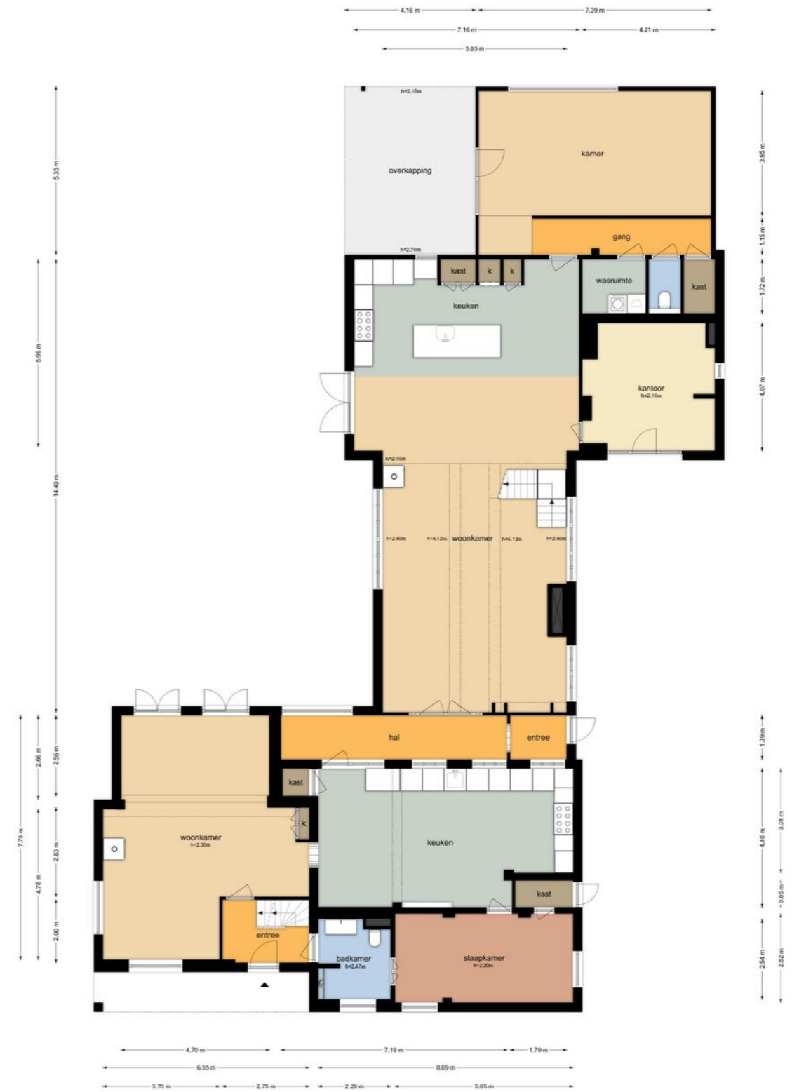
Gansoyen 39 - Drongelen Begane Grond

De plattegronden zijn geproduceerd voor professionele doeleinden en ter indicatie. Aan de plattegronden kunnen geen rechten worden ontleend. © www.oupland.nl