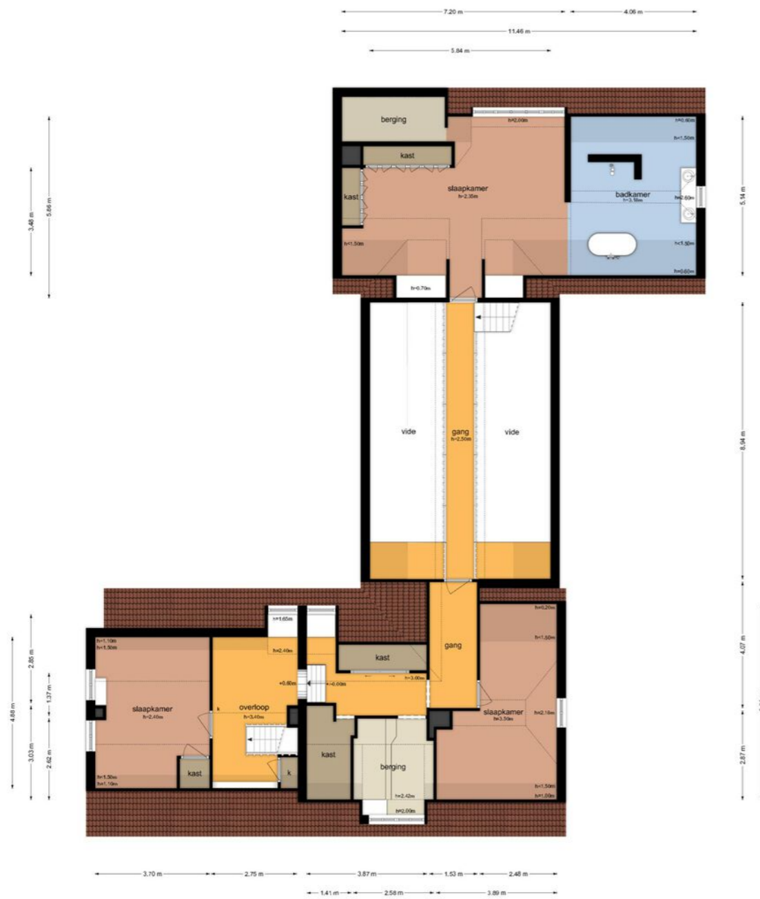
Gansoyen 39 - Drongelen Eerste Verdieping

De plattegronden zijn geproduceerd voor professionele doeleinden en ter indicatie. Aan de plattegronden kunnen geen rechten worden ontleend. © www.oupland.nl