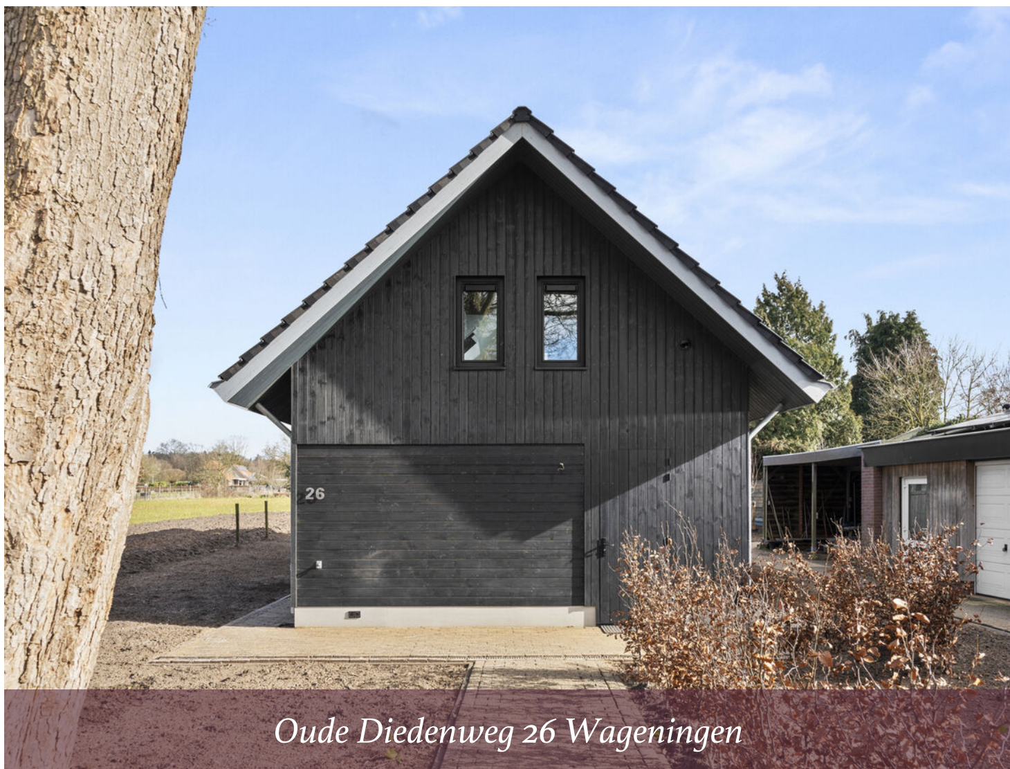
Oude Diedenweg 26 Wageningen