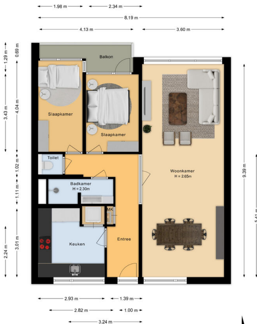
Professor Cobbenhagenlaan Tilburg Appartement

De plattegronden zijn bedoeld voor promotionele doeleinden en zijn slechts indicatief. Er kunnen geen rechten worden ontleend aan de plattegronden.