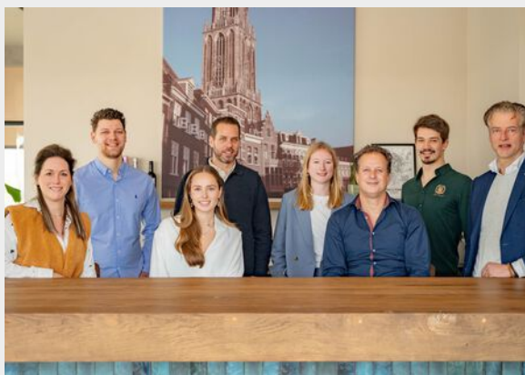
Kantoor Utrecht - Leidsche Rijn Willem Frederik Hermansstraat 698 Utrecht

Graag leiden we je rond door de woning en voorzien wij je van alle nodige informatie. Mocht er iets ontbreken, laat het ons weten. Zorg dat je tijdig een afspraak plant en het is aan te raden je eigen aankoopmakelaar in te schakelen.