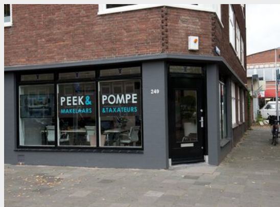
Kantoor Utrecht - Centrum Croeselaan 249 Utrecht

Wij zijn dagelijks actief vanuit Utrecht, Leidsche Rijn en Maarsse.