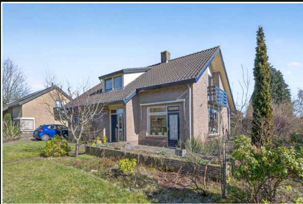
Eerbeek Beethovenstraat 2