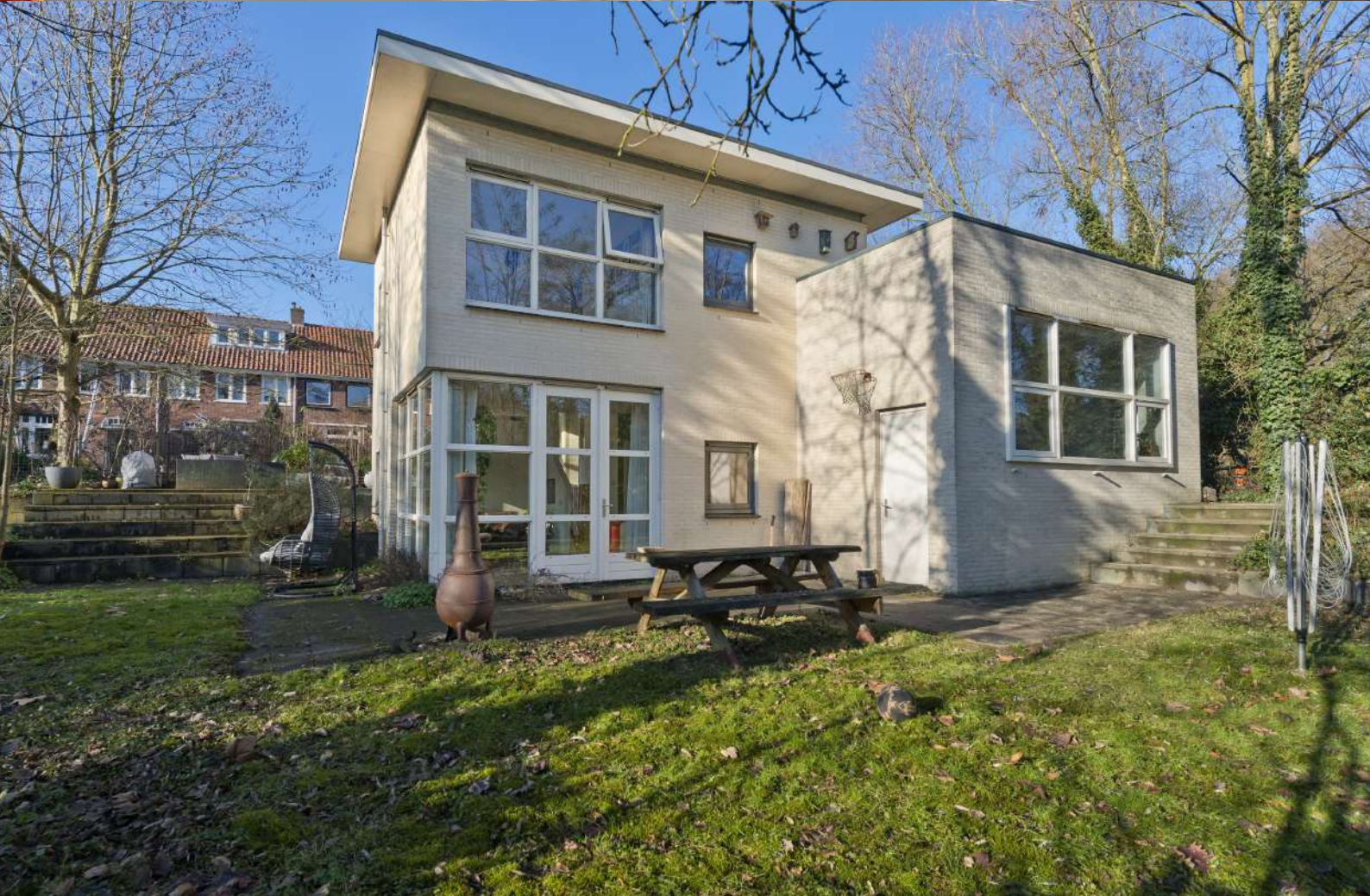
Frederik van Eedenstraat 2 Arnhem