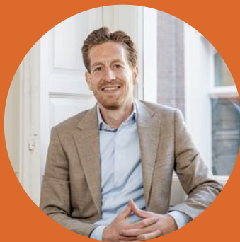
JOP WELP Makelaar

We helpen je graag verder op weg naar jouw droomhuis.