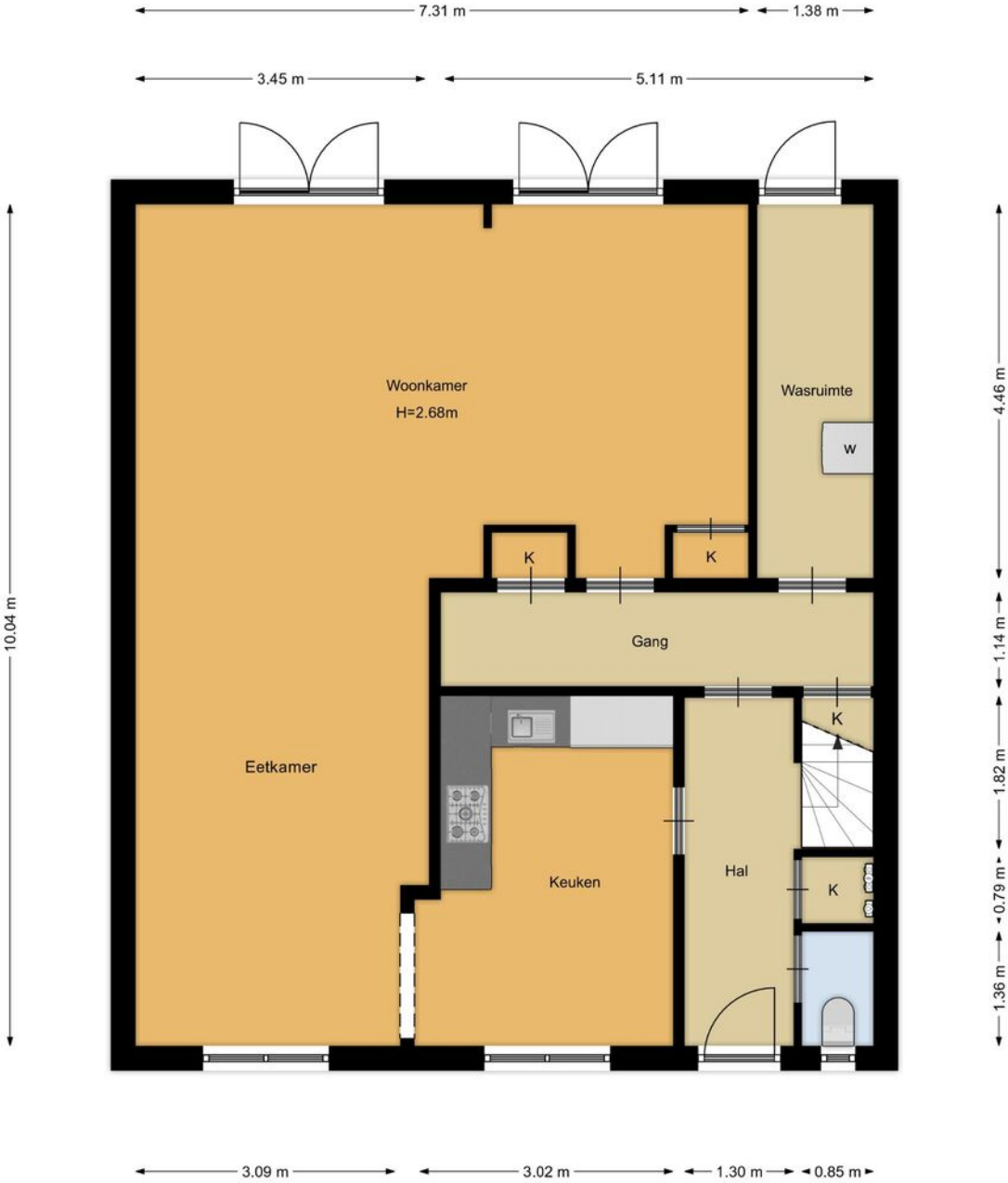
Molenberg 1, Huizen Begane grond