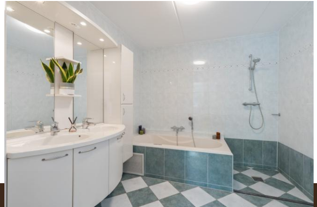
Vinkenkade 55 Vinkeveen