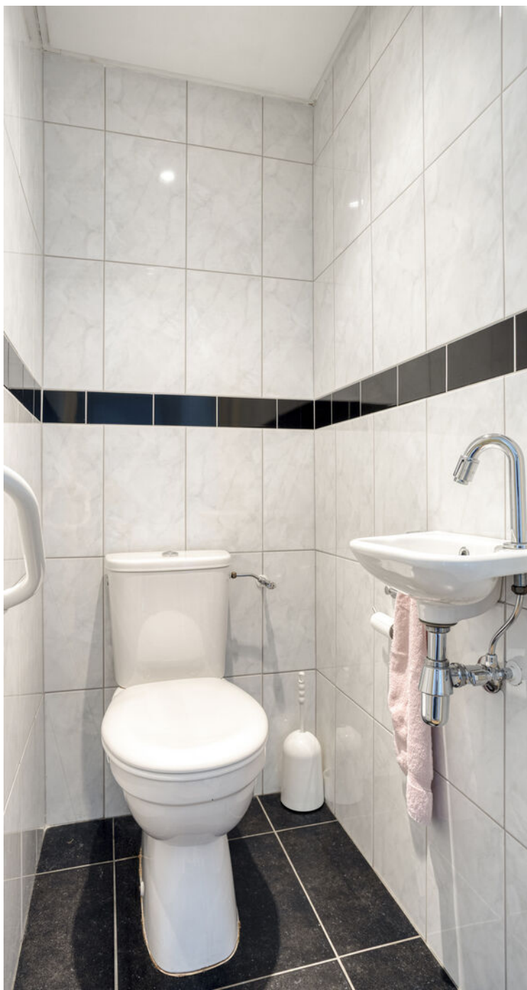
De toiletruimte is voorzien van een toilet met fonteintje.