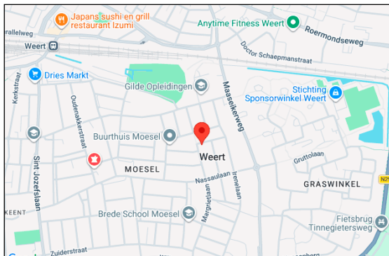
noorden kadastrale kaart