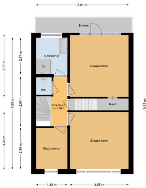
Jan Gijzenkade 157 Haarlem 1e Verdieping

Deze plattegrond is met de grootst mogelijke zorg samengesteld. Desondanks kunnen er geen rechten aan worden ontleend en kunnen er kleine afwijking zijn in de exacte maatvoering. www.agvastgoedmedia.nl