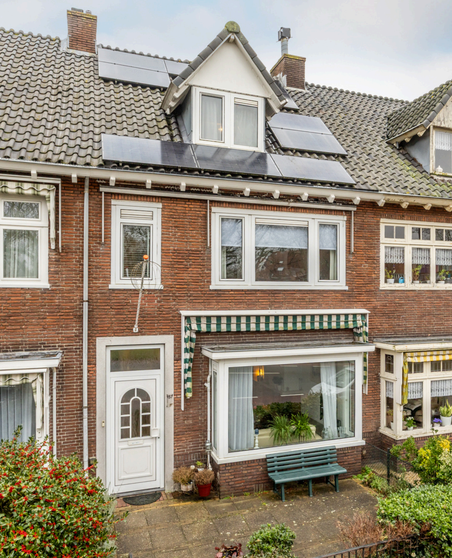
Jan Gijzenkade 157, Haarlem