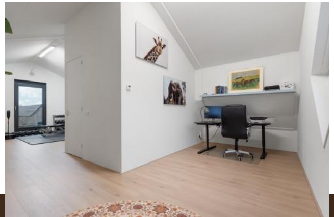
Omloop 5 Abcoude