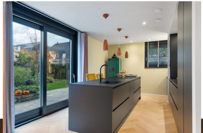
Omloop 5 Abcoude