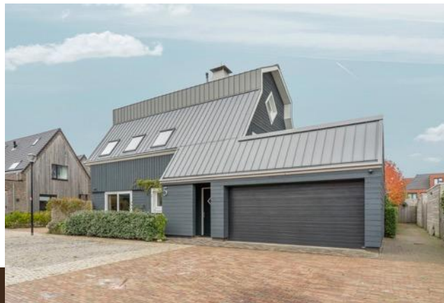
Omloop 5 Abcoude