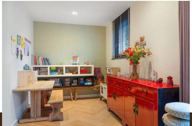
Omloop 5 Abcoude