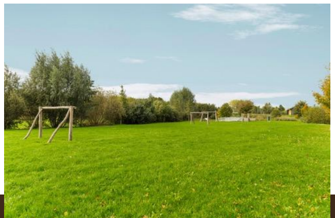
Omloop 5 Abcoude