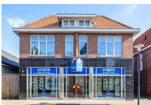
Waalwijk Grotestraat 365 0416 - 344 944 infowaalwijk@staete.nl