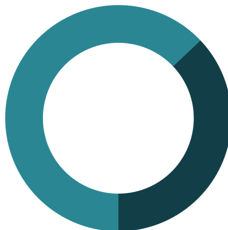
Koop / huur

0 - 14: 12% 15 - 24: 9% 25 - 44: 25% 45 - 64: 29% 65+: 24%