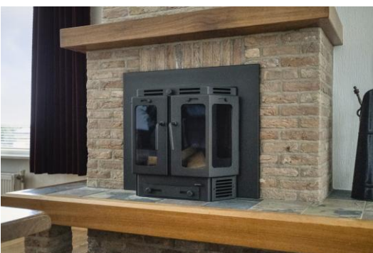
Weinig gebruikt rookkanaal, geschikt voor hout.

Onderstaande zaken blijven achter en zijn bij de koopsom inbegrepen: