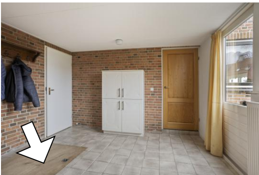
Bijkeuken met toegang tot de kelder, zie pijl. Afm. ca. 3.1 x 2.0 m., hoogte 1.7 meter