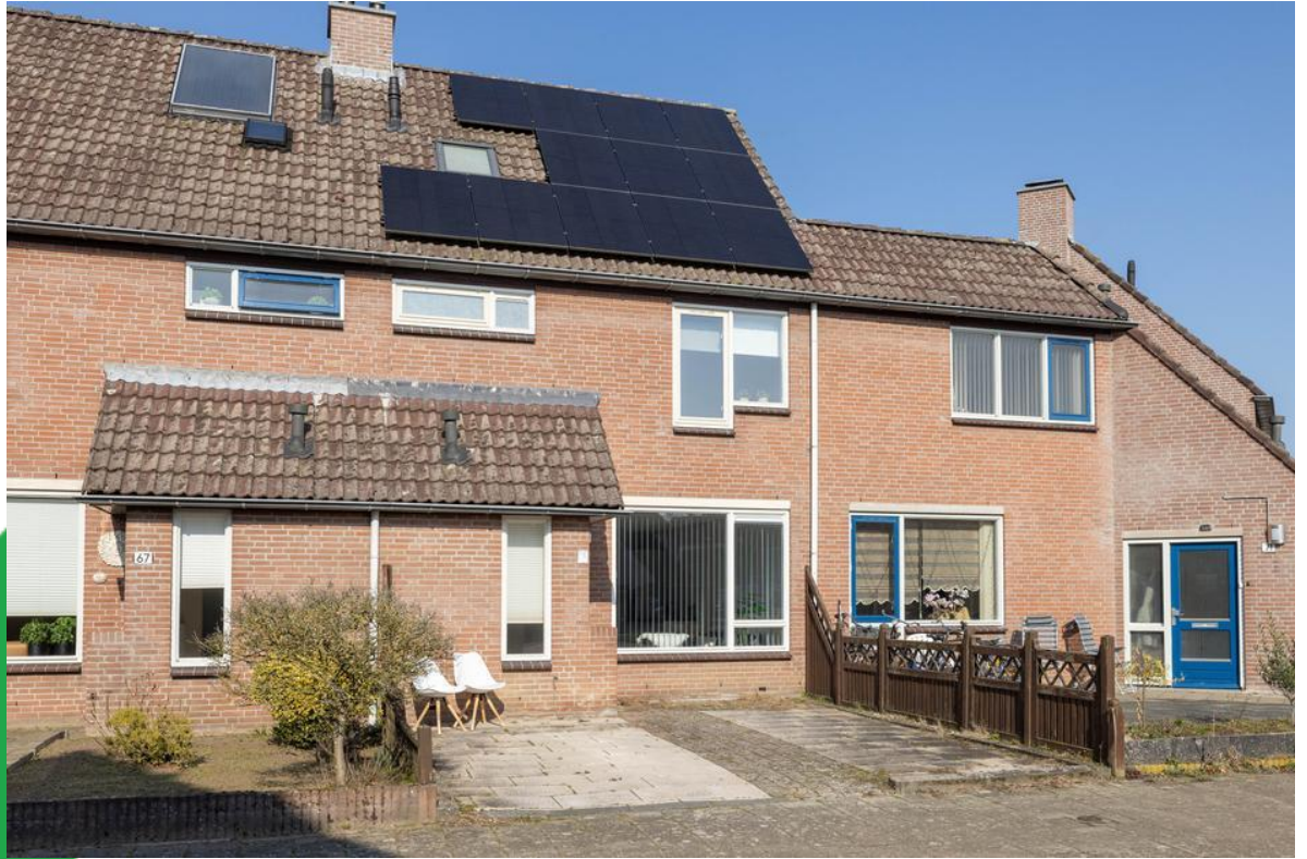
Tom Mandersstraat 69, 7558 MT Hengelo