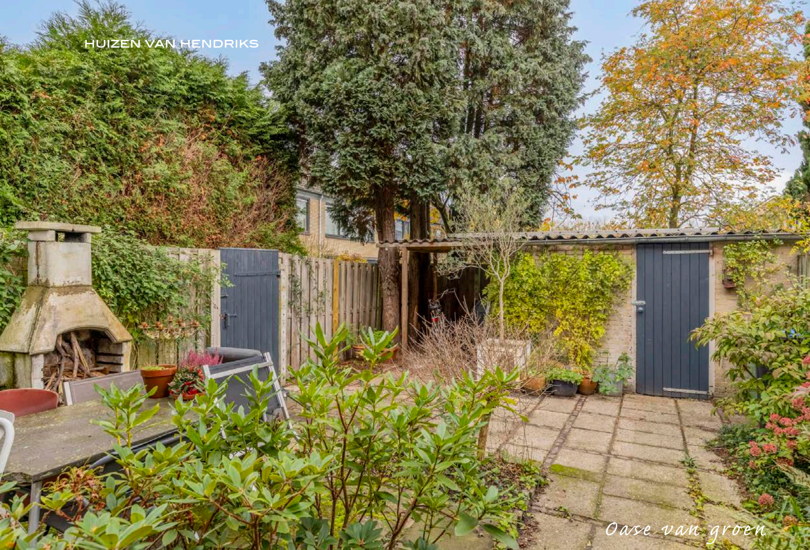
Oase van groen