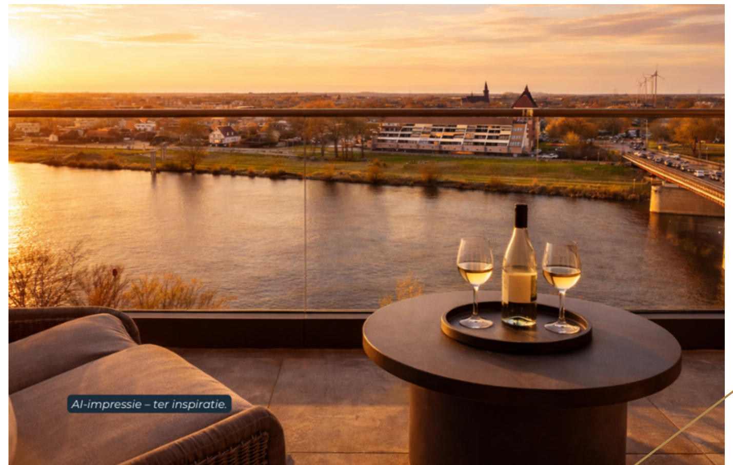
AI-impresie – ter inspiratie.