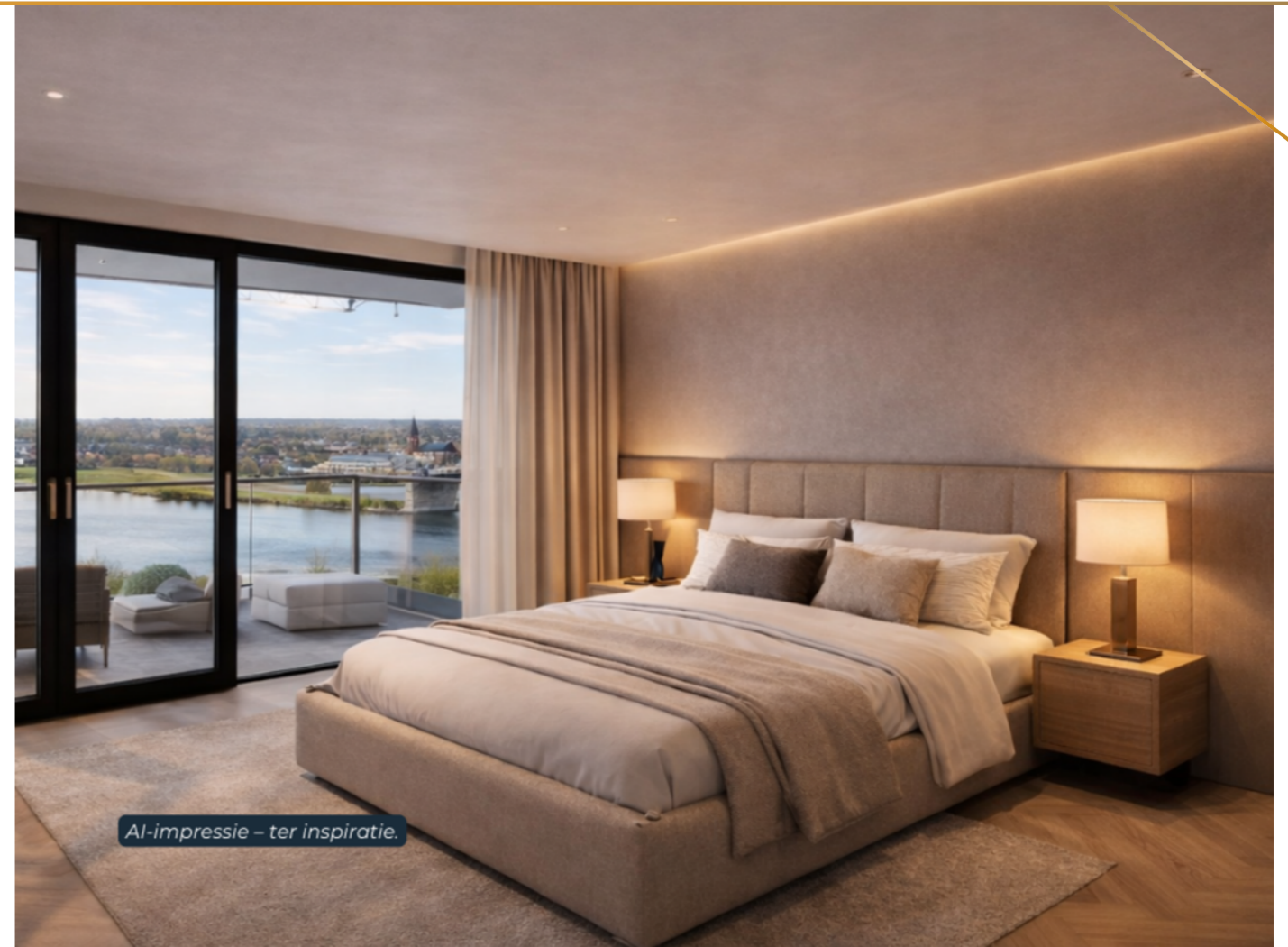
AI-impresie – ter inspiratie.