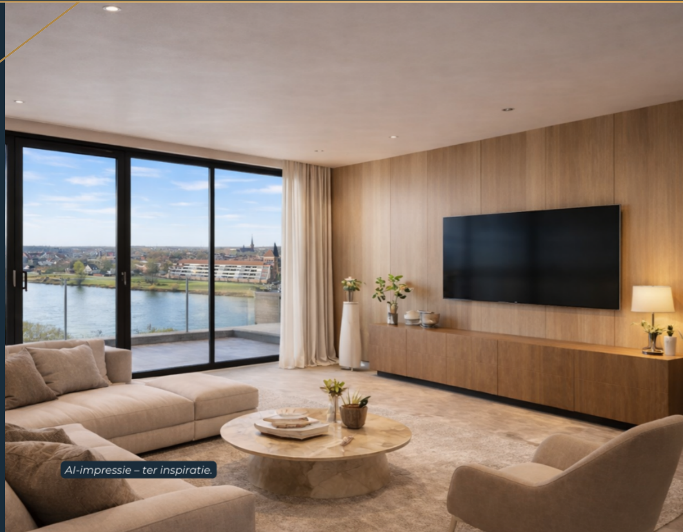
AI-impresie – ter inspiratie.