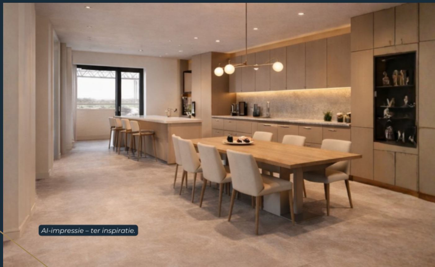
AI-impresie – ter inspiratie.