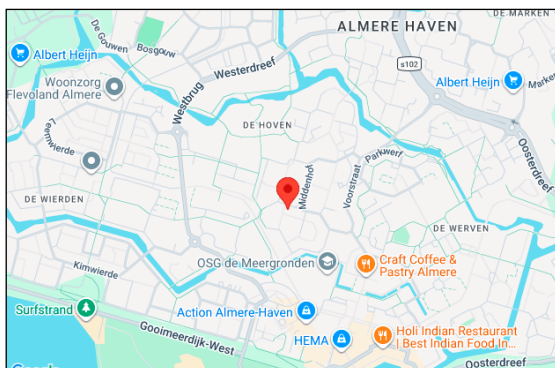
noorden kadastrale kaart