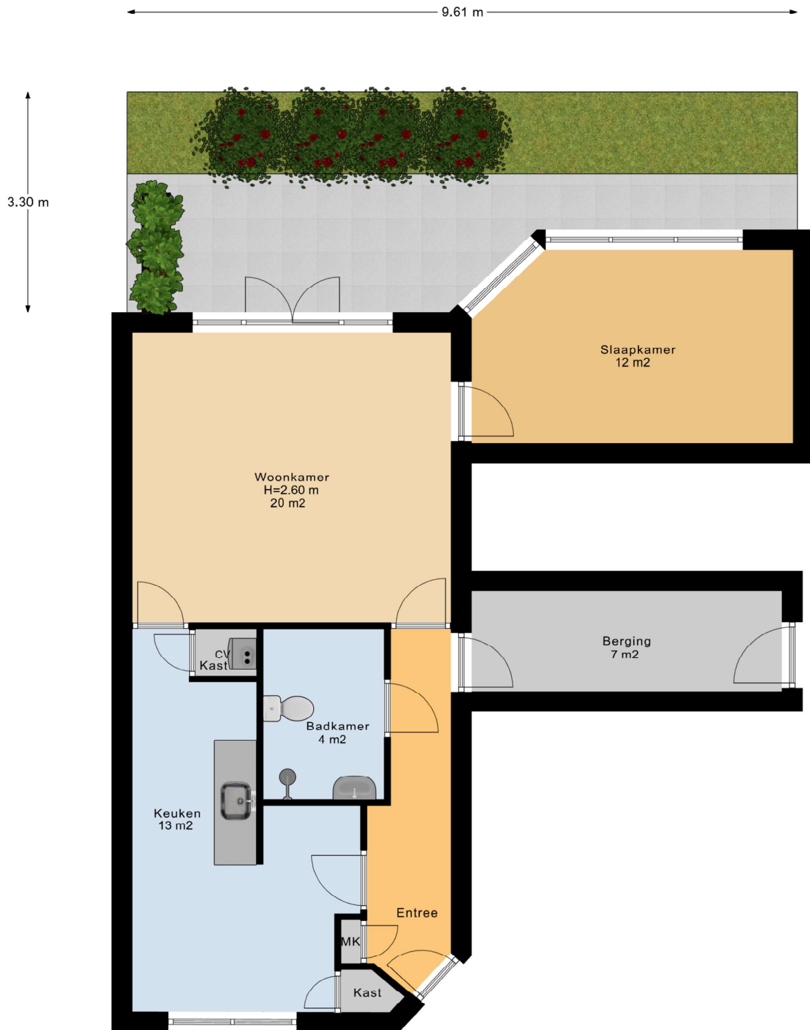
Begane Grond Tuin