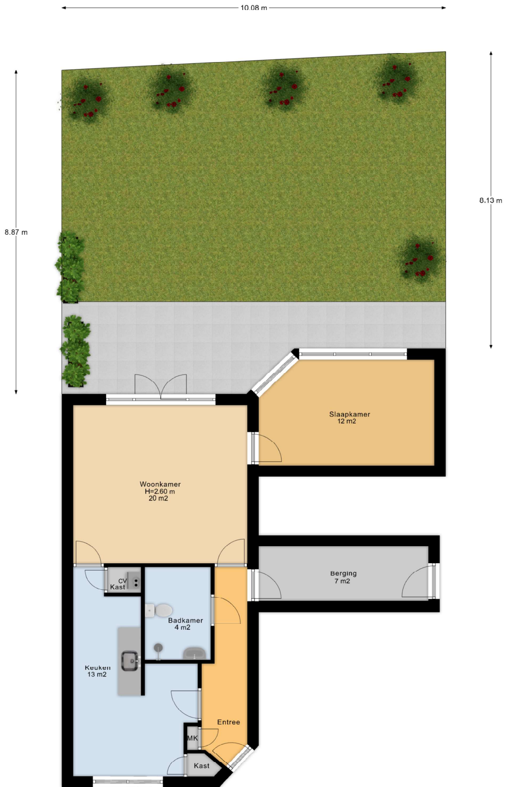
Begane Grond Tuin