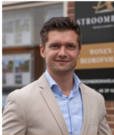
Harmen Stroomberg Register Makelaar Taxateur + BOG